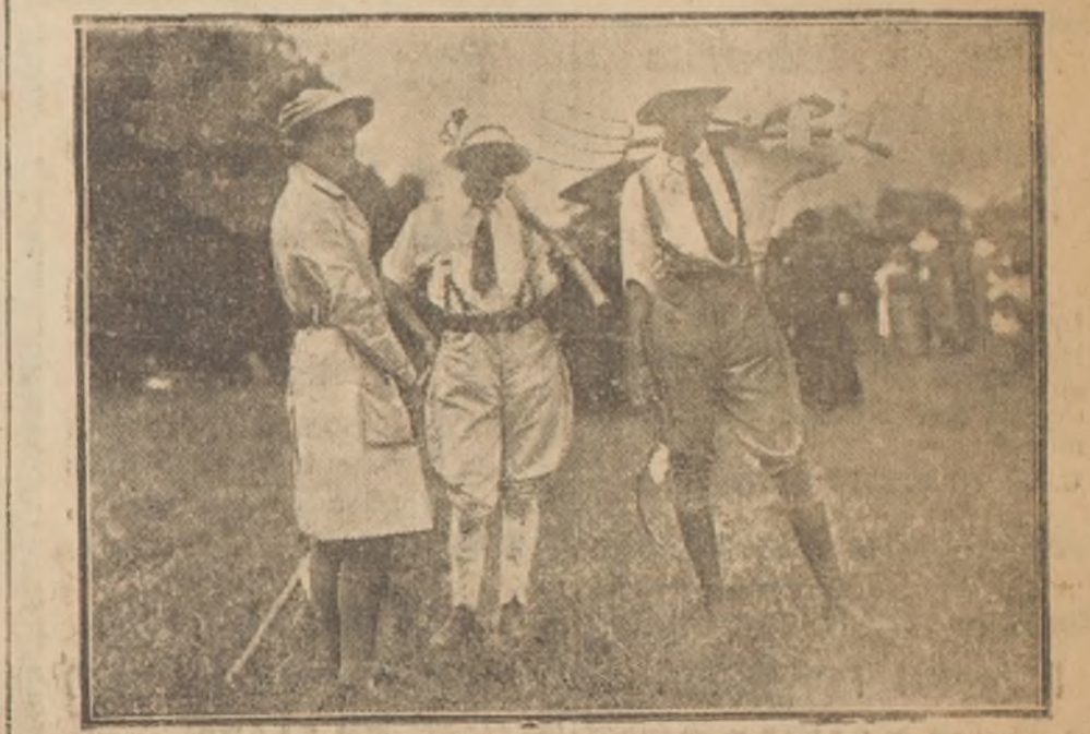
Algunos de los nuevos rivales del sexo fuerte, usando trajes masculinos.