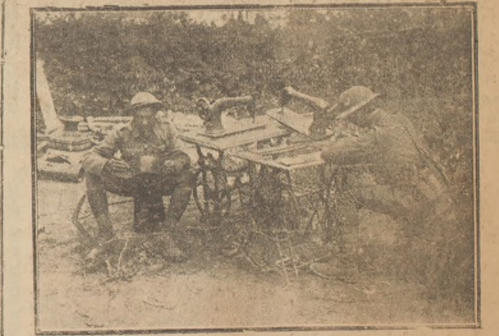
"Tommies", aprovechando, como escritorios, las máquinas de coser que han encontrado en una aldea.