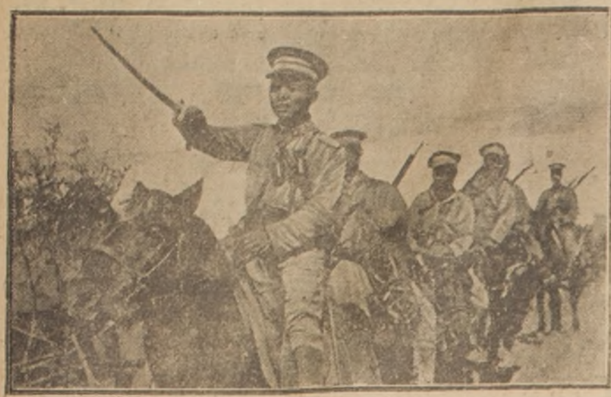
Caballería china en mantobras.

gansos, patos y cerdos, pájaros y faisanes, pasa el turista a una estancia, donde la esposa del labriego le ofrece té y pasteles de hojaldre rellenos de carne picada y cocida. Los niños, ocho o diez, p r