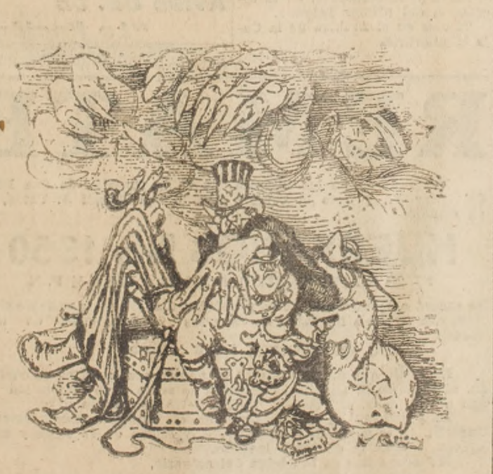
Caricatura de la revista alemana "Fliegende Blätter", que ha sido publicada con la leyenda: "Alguien que ha sido protegido por alguien que fue protegido por alguien que a su vez tendrá que ser protegido."

conselo, yo iré gustosa a llevarle flores a su tumba. ¿Quiere usted indicarme para ello el día de su cumpleaños, o el de su santo?