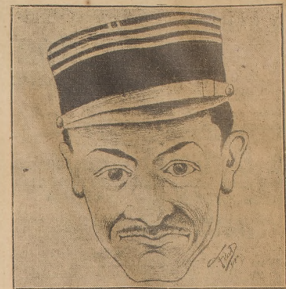
que con razón se le llamaba el as de los ases.

Como Guynemer era tan joven, todos sus compañeros lo trataban con un tono protector, lo que no le agradaba, pues quería imponerse y hacerse respetar. Un día efectuando un reconocimiento sobre la línea enemiga, fué él