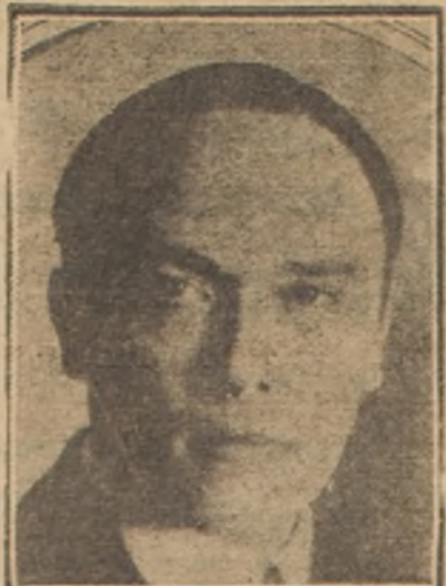
El Vicepresidente del Gobierno provido al caso, señor M. J. Terestchencko, se ha declarado que renunciará su cargo si no se establece pronto un Gobierno libre y firme

la verja del castillo, llegó cerca del lago, y en un adios eterno, se tiró al agua.