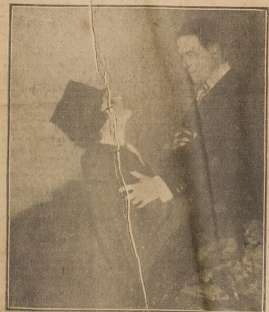
Ella adoraba a su marido, mas sufría tanto por las ofensas...

un enlace desigual para su hijo, y no quería a esa intrusa, — como la llamaba, — que no posea un céntimo y que ahora era duquesa de Derens.