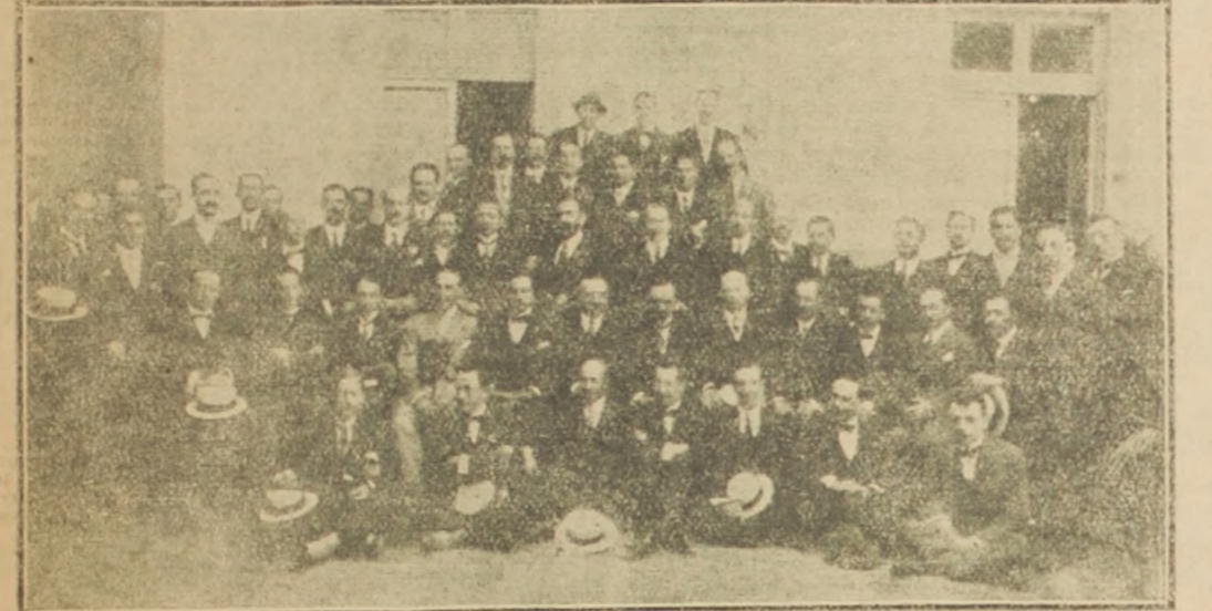
ASISTENTES AL ALMUERZO