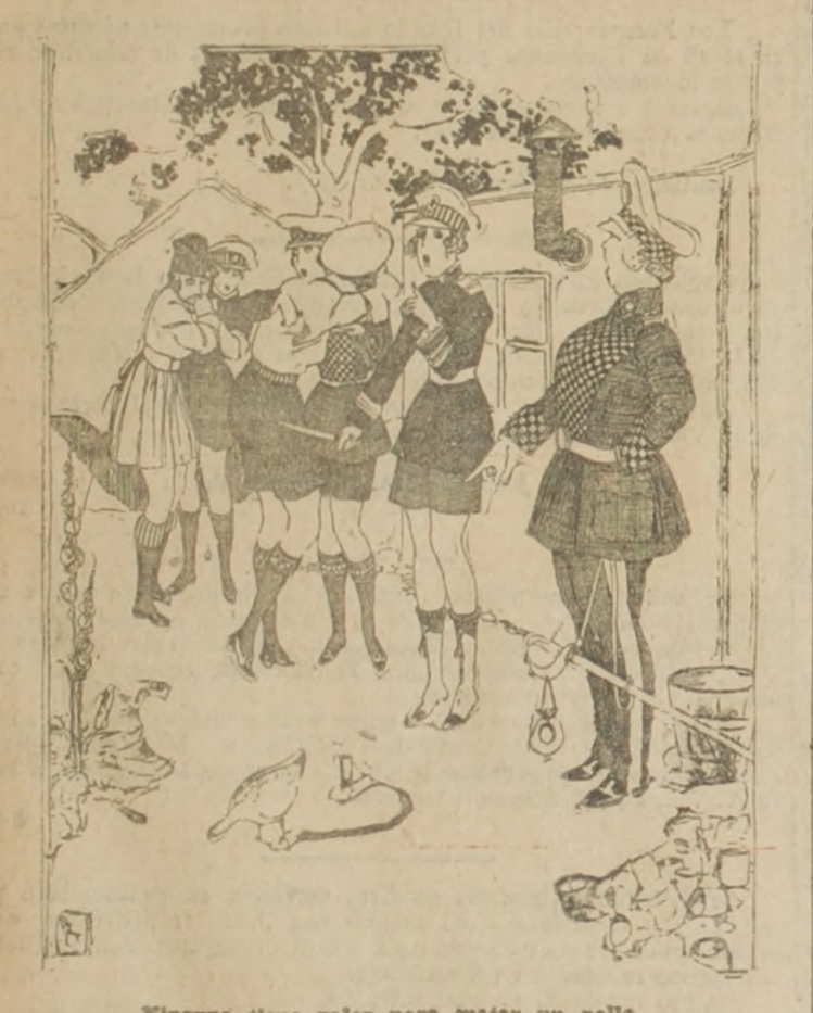
Ninguna tiene valor para matar un pollo

Después de la guerra de 1870, hubo en Francia una crisis semejante a la que acaba de producirse en España. Entonces el general Lewal, uno de los hombres que más trabajó en la reorganización del ejército francés, se pronunció enérgicamente contra los ascensos otorgados al pequeño grupo de oficiales que la suerte había arrojado a las colonias francesas de África, único lugar por el momento en que existía un estado de guerra.