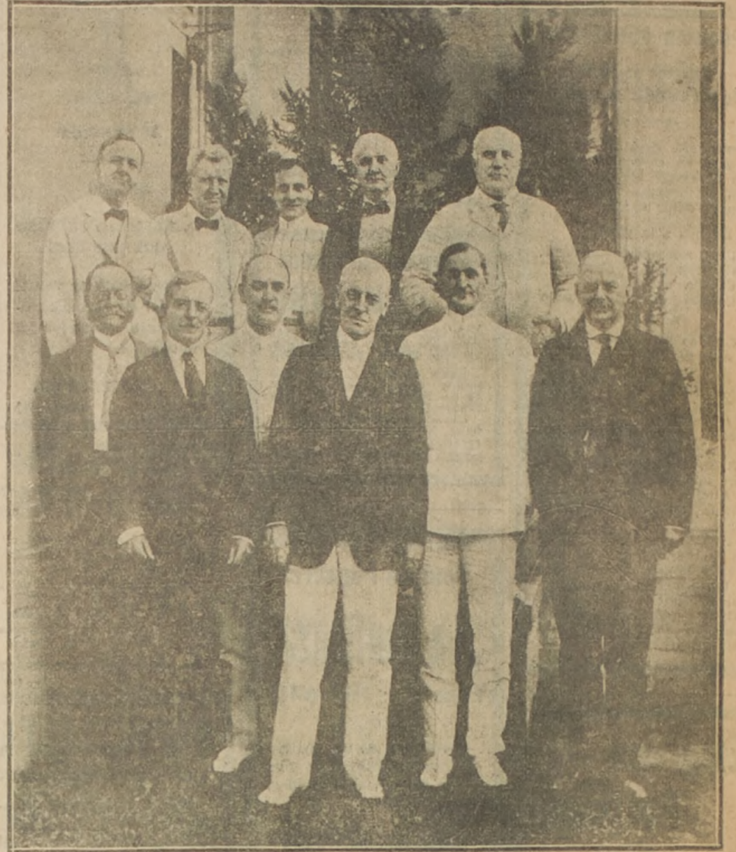
Esta es la primera vista que se hacen tomar al aire libre al Presidente norteamericano y su Gabinete. Aparecen en ella: de izquierda a derecha: William C. Redburn, secretario de Comercio; Robert Lansing, secretario de Estado; David F. Houston, secretario de Agricultura; el Presidente Woodrow Wilson; William Mc Adoo, secretario del Tesoro; A. S. Burleson, Director General de Correos. Atrás están sentados en el mismo sentido: Josephus Daniels, secretario de Marina; William B. Wilson, secretario del Trabajo; Newton D. Baker, secretario de Guerra; Thomas W. Gregory, Procurador General; y Franklin S. Lane, secretario del Interior.