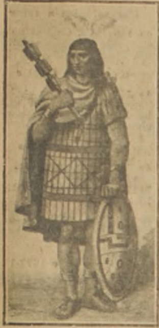
El cacique Anamurú

con que al siquiera había viviendas: los contados españoles que había, invieron que construir sus casas.