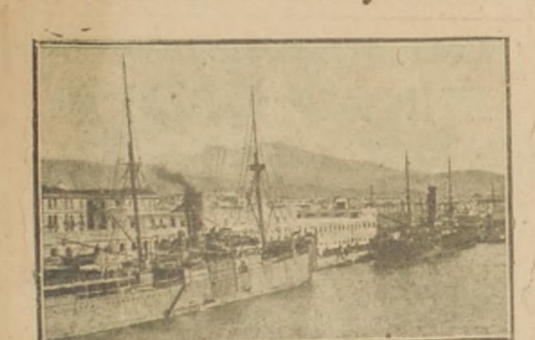
Según lo anunciamos en uno de nuestros telegramas, el Gobierno serbio ha decidido establecerse en la ciudad de Salónica, en espera de que las circunstancias le permitan volver al país.