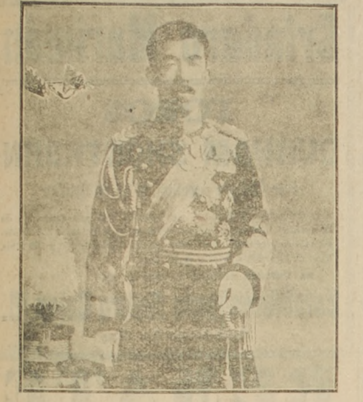
S. M. el Emperador Yoshihito

El nombre del Japon suena no sólo con amistosa simpatía para todo chileno, en virtud de las tradicionales relaciones que con el lejano imperio nos ligan, sino también como el de un país cuyo ejemplo debemos imitar. El Ja-