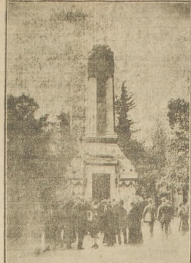
El mausoleo del señor don Pedro Montt.