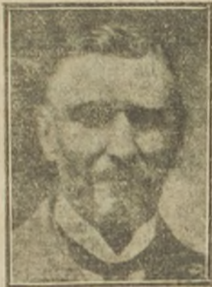
Sir Horace Plunkett