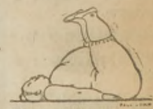
Ejercicios para acortar el frente