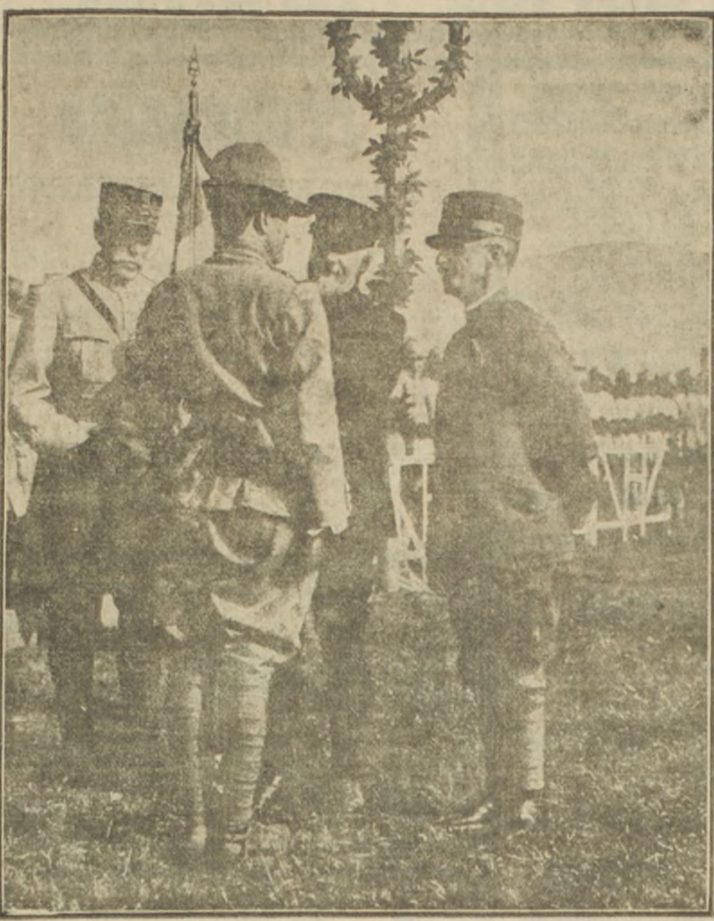
Antes de que se llevara a efecto la ofensiva simultánea del Isouzo y Verum, a mediados del mes de Agosto último, el Presidente francés M. Poincaré hizo una visita al frente Italiano. Nuestra fotografía lo representa en el momento de condecorar a un capitán de cazadores alpinos del ejército de Cadorna, en presencia del Rey Victor Manuel y del general Depaige

unanimidad y secretario Sir Francis Hopwood. La personalidad de Sir Horace Plunkett es un buen augurio para el éxito de la Convención, pues en su larga carrera pública ha sido un sostenedor incansable de la necesidad de dar al problema irlandés una solución conciliadora de todos los intereses. No sólo se ha preocupado del aspecto político de la cuestión irlandesa sino que le ha dedicado largos años al aspecto económico y agrario.