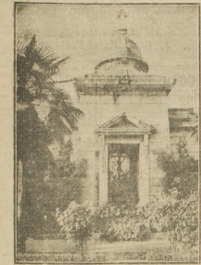
Tumba de la familia Almirante.

El día de todos los santos heredó ayer a medio Santiago a los cementerios. Fue una interminable romería que comenzó de mañana para terminar con las últimas luces del crepúsculo vespertino.