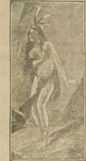
Una niña semi-desnuda de una belleza original y salvaje

Llamaronle la atención las mujeres criollas, con sus negros ojos y cabellos más negros todavía, y