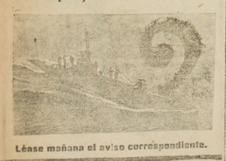
Léase mañana el aviso correspondiente.