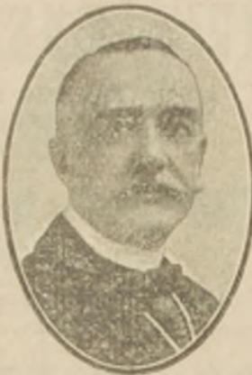
El famoso Ministro del Zar Nicolás, que tuvo a su cargo la organización de la policía de Petrogrado y que se encontraba preso, acusado de estar en connivencia con los alemanes, acaba de ser declarado loco por los revolucionarios rusos.

A seis llegan hasta ahora los refectorios escolares que funcionan en nuestra capital por cuenta de la