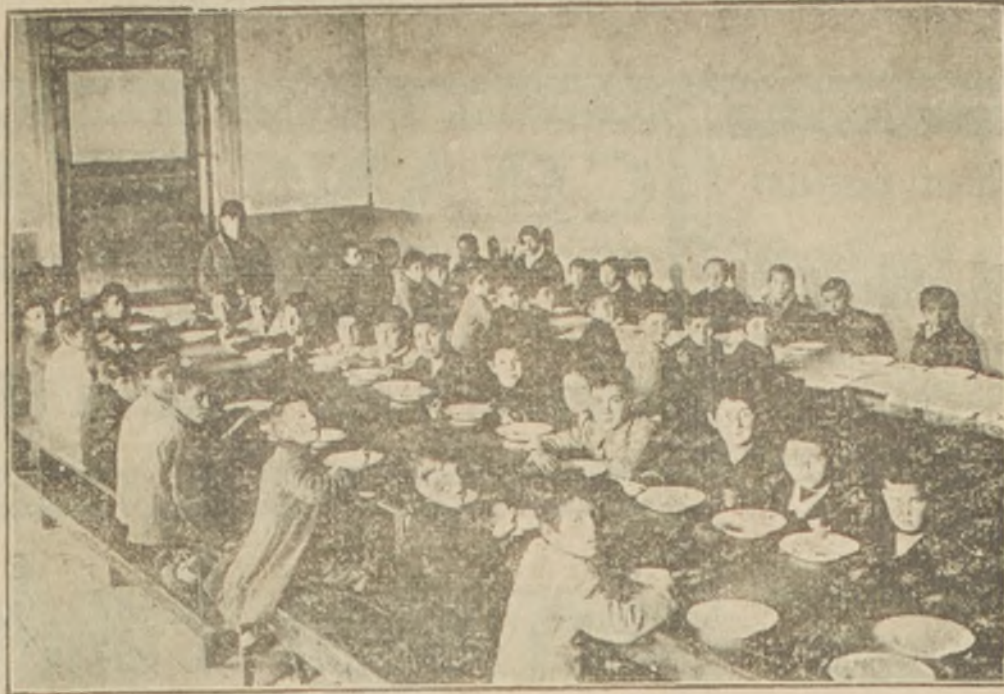
La fotografía representa almacenando a los alumnos de la escuela fiscal núm. 225 que es una de las que tiene a su cargo la simpática institución de las "Ollas Infantiles" acerca de la cual damos algunos datos en esta misma página