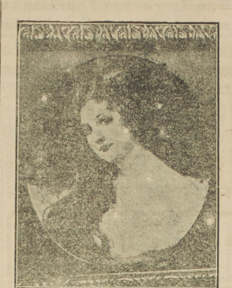
En el Club de Señoras. Brillante bajo todo punto de vista estuvo la velada que se efectuó ayer en la tarde en esta simpática institución social...