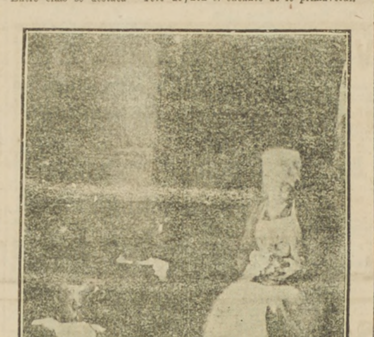
En el Club de Señoras. Brillante bajo todo punto de vista estuvo la velada que se efectuó ayer en la tarde en esta simpática institución social...

En la tarde de ayer reanudó sus tareas la Comisión Mixta de Presupuestos. Despachó hasta la partida 2.ª del presupuesto de Guerra.