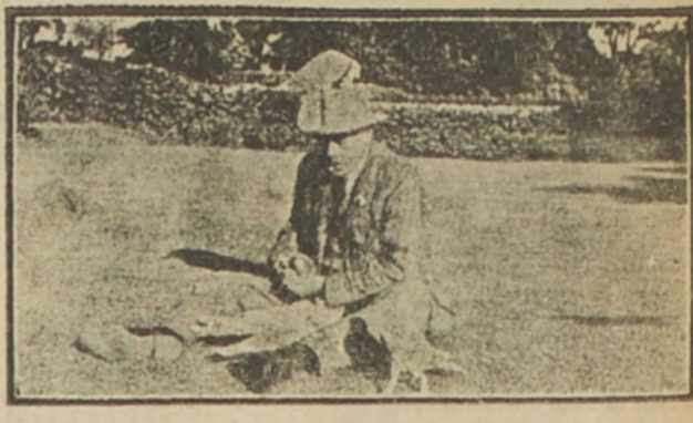
Un caballero inglés que no quiere dar su nombre a la prensa se dejó retratar en los momentos en que daba de comer a algunas de las palomas de su quinta...