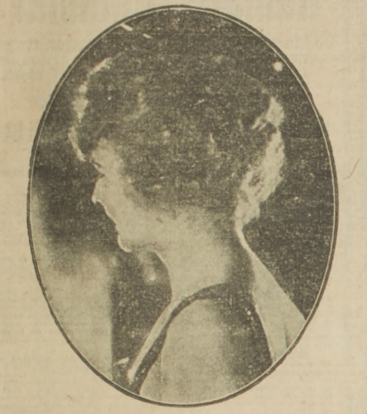
Mrs. Triplet la esposa divorciada del Reverendo Doctor Triplet que no atañen directamente a su santo ministerio...