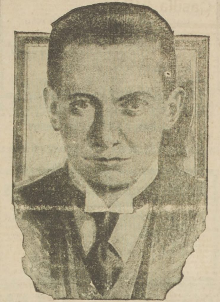
Alejandro Fedorovitch Kerensky el gran hombre de Rusia que ha publicado en esta página una política y de una acción social...