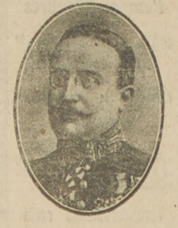
Monsieur André Tardieu, alto comisionado del gobierno francés en los Estados Unidos.

Con fecha 18 de Septiembre último, Monsieur André Tardieu, alto comisionado del gobierno francés en los Estados Unidos y miembro de la Cámara de Diputados de Francia, cuyo retrato publicamos, dió a la prensa yanqui