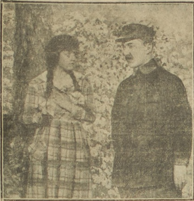
El soldado se quedó un momento absorto al ver a la muchacha y ésta también le miró asombrada al advertir en aquel cierto semblante que desdecía de su corpulencia y de su rostro enérgico y decidido.