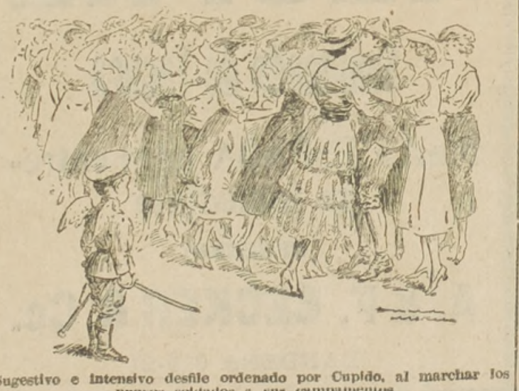
Sugestivo e intenso desfile ordenado por Cupido, al marchar los nuevos soldados a sus campamentos