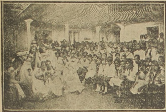
ALUMNAS DEL ESTABLECIMIENTO PRESENTANDO UNA DANZA EJECUTADA POR UN GRUPO DE SUS COMPAÑERAS

El Ministro de Instrucción, don Arturo Alessandri, que no pudo concurrir a ella por quehaceres imponderables, comisionó a su señora esposa, la que tuvo palabras de aliento y de franco elogio para los diversos trabajos presentados.