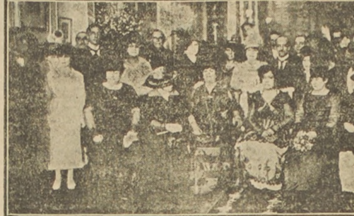
ALGUNOS DE LOS ASISTENTES A LA RECEPCION, EN LA LEGACION

El Ministro señor Cardoso ofreció una copa de champagne a los visitantes.