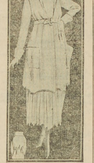
Elegante tailleur de gabardina o tricrótina blanco. La falda es enteramente tableado. Larga chaqueta sostenida al talle por un cinturón. Gran cuello bolsillo y puños del mismo género.