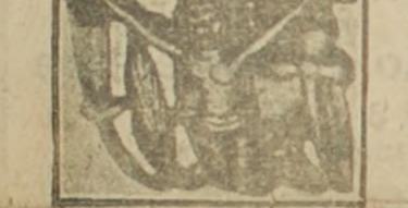
Como se ve, el famoso anillo tiene varias similitudes con la pasión de Cristo.

Nueve años después de haber clavado Lutero, en la puerta del convento de Wittenberg sus 95 tesis, contra el matrimonio, con Catalina Van Boren exreligiosa de un convento de esa misma ciudad.