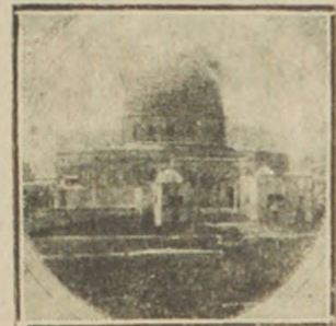
Jerusalem. La célebre mezquita de Omar

La ruleta gira vertiginosamente. Los azules despiden de cuando en cuando a la bola con un ruido seco. De pronto la bola entra en un cajetín y el crupier canta el número. —Doce, Rojo, Manque, Par... —¿Lo ve usted? — suspira don Salustiano. — Era indudable. No hay manera humana de ganar.