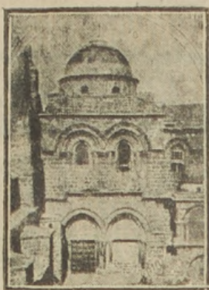
Jerusalem. La iglesia del Santo Sepulchro. Con la caída de Jaffa se decidirá también, probablemente, la suerte de la ciudad santa de Jerusalem que tendrá que ser evacuada por las fuerzas turcas ante la aproximación de las tropas aliadas.