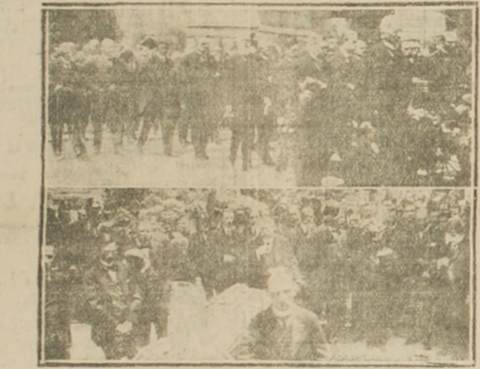
El cortejo entrando al Cementerio.—Oyendo los discursos