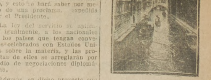
Venecia. El célebre Palacio de los Dux y la Biblioteca.