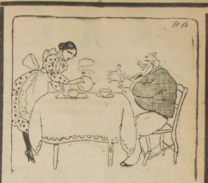
“Te Dominó” y Ud... ¿Qué más quiero?

El señor de Osma, modesto como todos los hombres de verdadero valer, despliega en sus modales esa elegancia desenfada que se ve en los señores de alto rango de la nobleza peruana.