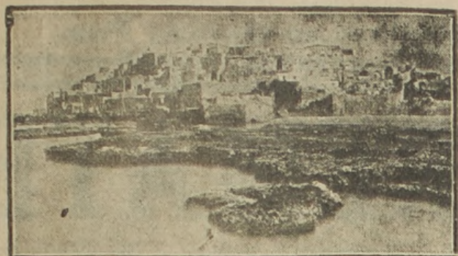
Vista del puerto de Jaffa desde el mar. Jaffa, una de las ciudades más antiguas de la Tierra es el puerto de Jerusalem, de la cual dista apenas 55 kilómetros. Tiene unos 16,000 habitantes. Los ejércitos británicos han ocupado ya, según lo anunciamos en nuestra sección ilustrada.