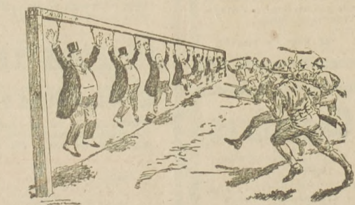
Un semanario yanqui propone este sistema al Ejército para la práctica de la enseñanza de la bayoneta.