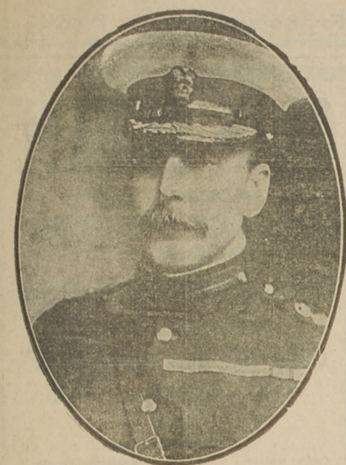
Mayor general Sir Stanley Maude

Gran popularidad ha llegado a adquirir en todo el Imperio británico el jefe de las operaciones en la Mesopotamia, quien, según informes telegráficos acaba de fallecer después de una corta enfermedad.