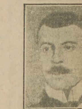
Señor Sidónio Pais, a quien la revolución lusitana ha colocado en la presidencia del consejo de Ministros, en sustitución de don Alfonso Costa

Proponiamos a nuestros lectores una información gráfica de las personalidades que han tenido mayor relieve en el movimiento insurreccional que conmueve a la patria de Camões.