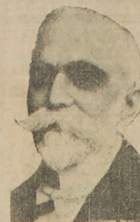
Señor Bernardino Machado, Presidente de la República portuguesa