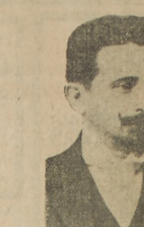
Señor Alfonso Costa jefe del Gabinete, que fué derrocado por la revolución