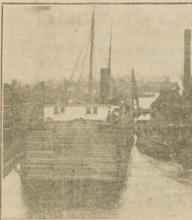
LA POPA DEL "NORTH WIND" NAVEGANDO POR LAS ESCLUSAS DEL CANAL WELLAND