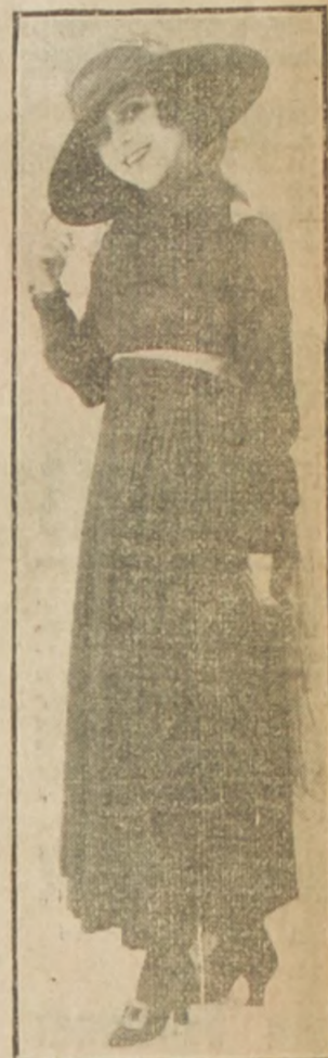
Traje de raso negro. La falda es recogida y adornada con bordados de seda azul, el mismo adorno en el corpiño. Gran cuello y cinturón azul

2.º Se eleven las tarifas de la expresada Red Central en un 10%.