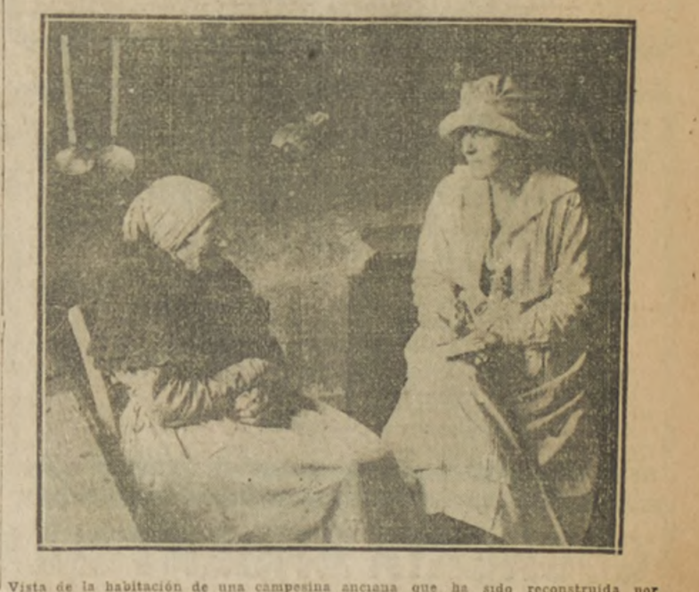
Vista de la habitación de una campesina anaciana que ha sido reconstruida por los soldados franceses al reconquistar la comarca devastada del norte.