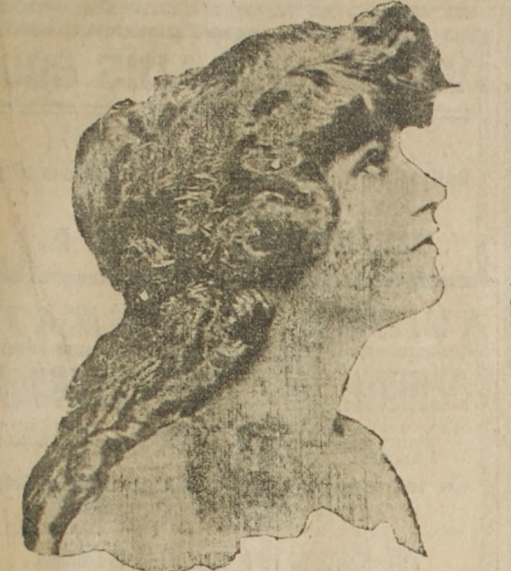
Entre las obras que obtienen mucho éxito en uno de los escenarios de Nueva York figura una revista titulada "Miss 1917" en la cual figuran numerosas escenas. Una de las que son más festejadas por el público neoyorquino debido a su belleza y a su gracia, según dice uno de los últimos números de "The World", es Marion Davies, cuyo retrato publicamos