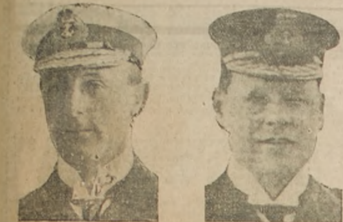
El almirante Sir John Jellicoe, hasta que fue Lord del Almirantazgo a quien el Rey Jorge V ha premiado, nombrándolo Par del Esmo. El vice-almirante Sir Rosslyn E. Wemyss, ascendido a 1er Lord del Almirantazgo británico, en sustitución del almirante Jellicoe.