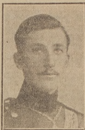
El heredero de Bulgaria, Principe Boris, en cuyo favor se habría hecho la abdicación

—Eperre usted—añadió—no está usted bien colocado para contestarme. Siéntese allí, en aquella silla... y yo me sentaré aquí... No deje usted de mirarme y ponga cuidado en la contestación... Sobre todo, le suplico que sea completamente sincero... pues me ha de sacar de una duda enorme... Yo temblaba de pies a cabeza. Estábamos los dos sentados exactamente en la misma posición, que el mes anterior, el día en que mi hermana nos dejó solos para ir a buscar unas fotografías. —Bueno — me dijo a media voz — si el espejo me dijo la verdad, la verdad pura... hay que hacerle hablar otra vez. Afortunadamente, en aquel momento prodigioso en que se había de decidir mi suerte, aunque me turbé muchísimo, no cometí una estupidez. Contesté como debía contestar; me llevé la mano a los labios y le tiré el mismo beso que la otra vez a la adorable cabecita rubia... y como entonces — sólo que ahora lo vi — el espejo repitió fielmente mi ademán. Y Francesca — preguntó muy seria — ¿Es para siempre? — Yo me arrojé a sus pies, besé sus vestidos sollozando de amor, y ella, llevada del instinto supersticioso de su raza, me preguntó: —¿No cree usted que los espejos antiguos, a fuerza de mezclarse en la vida íntima de los seres no concluyen por tener una especie de alma? J. H. ROSNY.