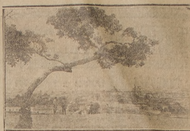
Vista general de Guatemala

Reciente está todavía la impresión que causó la serie de fenómenos sísmicos que arruinaron la capital de la floreciente República del Salvador, cuando viene el cable a transmitirnos la noticia de que un terremoto ha destruido la capital de otro país centro-americano: la importante ciudad de Guatemala. La actividad volcánica en esa región del continente, es la determinante de esa multiplicidad de catástrofes. El volcán de San Salvador fué, como saben nuestros lectores, el que comovió hasta sus cimientos a la ciudad salvadoreña a principios de año y con toda probabilidad alguna erupción del Santa María, del volcán de fuego o de uno de los muchos que se muestran habitualmente activos en territorio guatemalteco han producido ahora la destrucción de la primera ciudad de aquella República. El distinguido Ministro de Guatemala en Chile, señor don Eduardo Peñar, a quien acudimos en demanda de informaciones, se sirvió manifestarnos que hasta ayer no le había llegado ningún telegrama de su gobierno sobre este lamentable suceso.