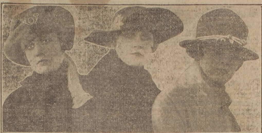
ESTOS TRES SOMBREROS DENOTAN, SEGUN EL MODISTO, OTRAS TANTAS FUENTES DE INSPIRACION. LA BOINA FUE INSPIRADA POR LOS GORROS DE LOS SOLDADOS ALPINOS; LA ESCARAPELA EN EL TERCER CORNIO REFORMADO QUE APARECE EN EL CENTRO, RECUERDA A LOS FRANCESES, Y EL TEJANO DE LA DERECHA SU TIPICA TOQUILLA SE HA PUESTO DE MODA EN HOMENAJE A LA ENTRADA DE LOS YANQUIS A LA GUERRA

con palpitaciones dolorosas. Constantemente pensaba en el suicidio.