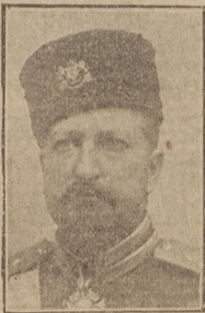
S. M. Fernando I Zar de Bulgaria, quien se dice que ha abdicado la corona en favor de su hijo Boris