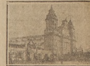
Catedral de Guatemala

Reciente está todavía la impresión que causó la serie de fenómenos sísmicos que arruinaron la capital de la floreciente República del Salvador, cuando viene el cable a transmitirnos la noticia de que un terremoto ha destruido la capital de otro país centro-americano: la importante ciudad de Guatemala. La actividad volcánica en esa región del continente, es la determinante de esa multiplicidad de catástrofes. El volcán de San Salvador fué, como saben nuestros lectores, el que comovió hasta sus cimientos a la ciudad salvadoreña a principios de año y con toda probabilidad alguna erupción del Santa María, del volcán de fuego o de uno de los muchos que se muestran habitualmente activos en territorio guatemalteco han producido ahora la destrucción de la primera ciudad de aquella República. El distinguido Ministro de Guatemala en Chile, señor don Eduardo Peñar, a quien acudimos en demanda de informaciones, se sirvió manifestarnos que hasta ayer no le había llegado ningún telegrama de su gobierno sobre este lamentable suceso.