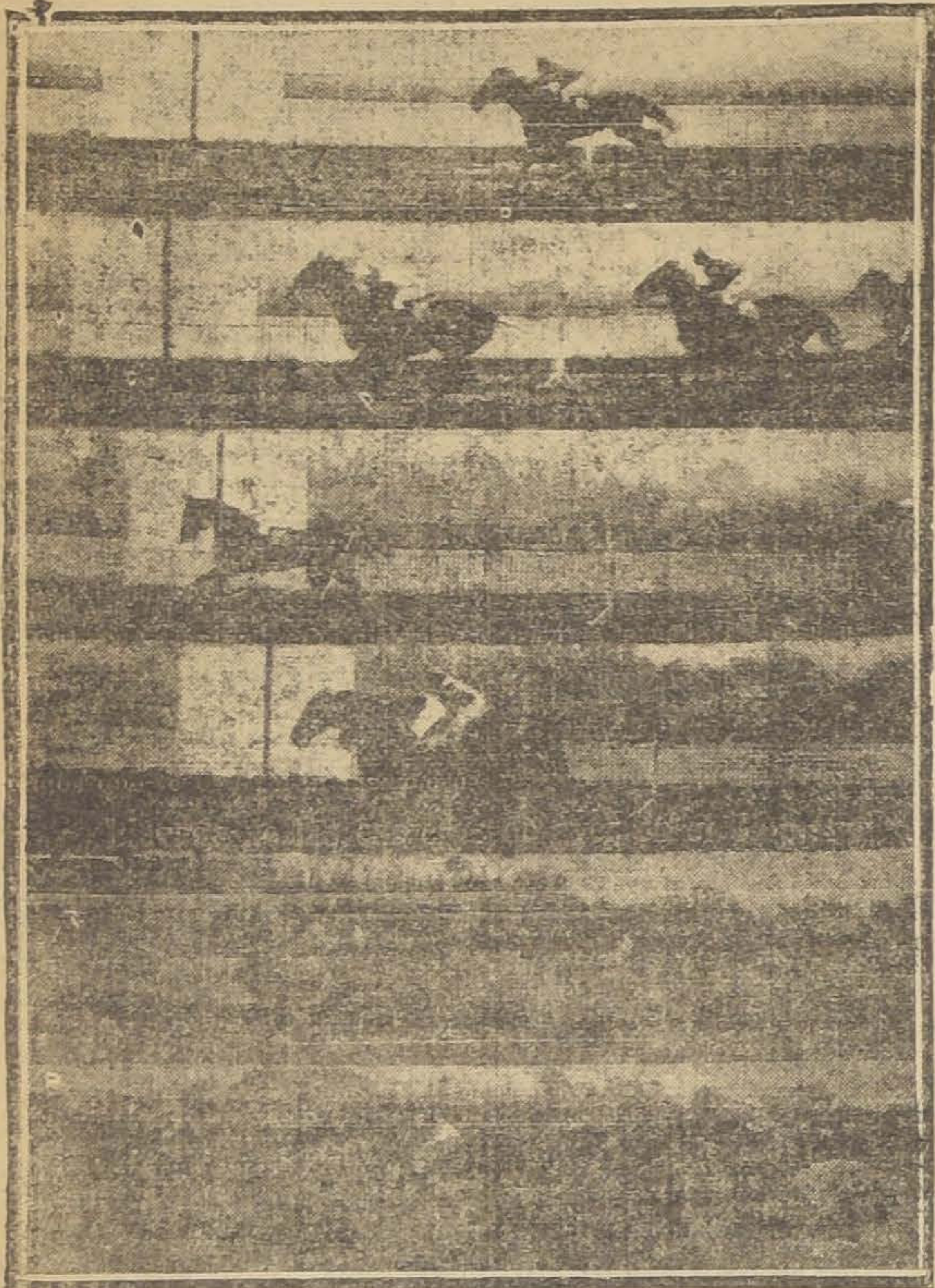
1.- FRAISY, FUSIL, NIZA Y ANTONIO. 2.- GUILLOTINA, SUNLIGHT, FAJARITA Y NAPA. 3.- PORTE CIGARETTE, BAHIA, LA LUNE Y ALICE BELLE. 4.- HARRY LAUDER, FERNET, TITANIC Y SARPENTIA. 5.- GIL BLAS, WILIBRODO, ULLI Y DON NICA. 6.- BALTICO, GLADIADORA, EMBROLLONA Y DUELO.

26 la raya con dos cuerpos de luz sobre Fusil, que remató delante de Niza. Cuarto Antonio. Tiempo: 1.31.25.