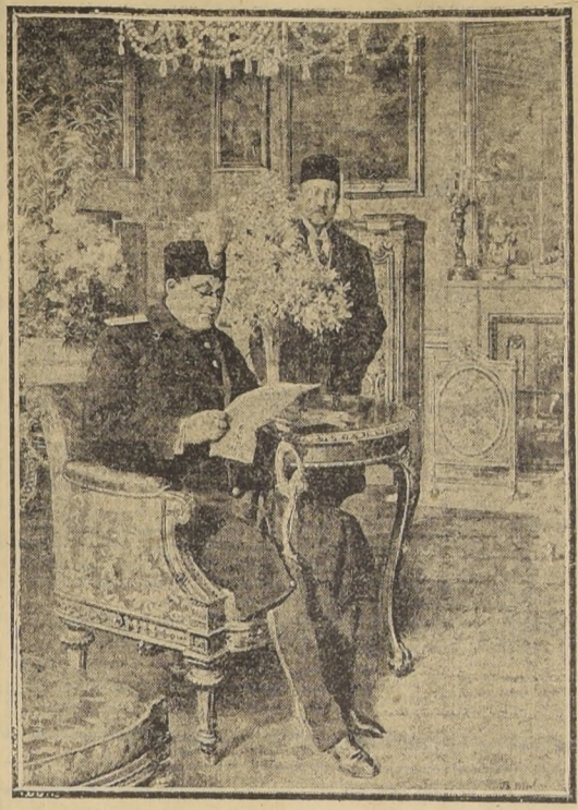
EL SULTAN AHMED SHAH KAJAR, SHAH DE PERSIA, EN SU RESIDENCIA EN BUCKINGHAM PALACE DE LONDRES, A DONDE LLEGO ACOMPAÑADO DE UNA NUMEROSA COMITIVA