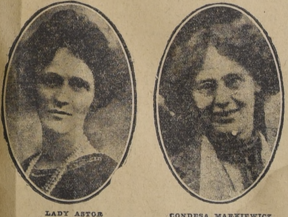
LADY ASTOR CONDESA MARKIEWICZ

Ha un año, cierto número de mujeres quiso aprovecharse de las ventajas que les daba la reforma electoral en Gran Bretaña, con el fin de presentar su candidatura a un asiento en la Cámara de los Comunes. Todas ellas fueron de-