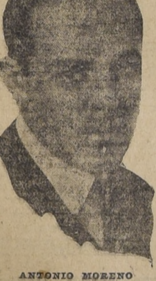
ANTONIO MORENO Intérprete de "El genial entrometido", película que hoy se exhibe en los diversos cines de Santiago

Noticias Cinematográficas "EL GENIAL ENTROMETIDO". Para hoy está anunciado el estreno de esta creación de aventuras. En ella actúa como principal intérprete el simpático actor Antonio Moreno.