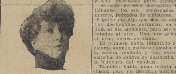
SARAH BERNHARDT EN UN PRESIDIO YANQUI

Un día recibí una carta que decía: "Señora: Somos seis condenados a muerte. Nuestro único deseo, antes de morir, es verla y oírlo. Tenga piedad de los que van a dejar este mundo; diga que sí, y el director de la Cárcel solicitará oficialmente de usted el cumplimiento de este deseo..."