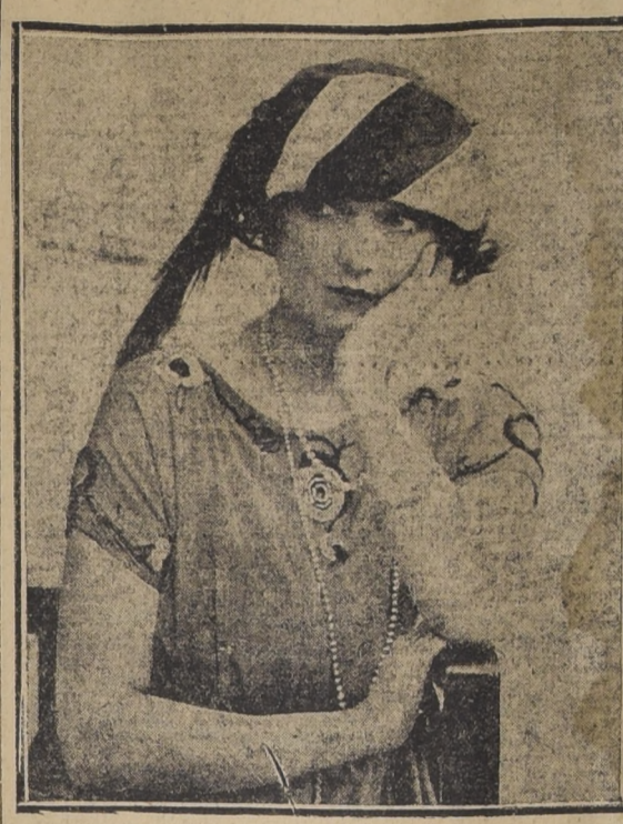
EN EL OXFORD, DE LONDRES, SE HA ESTRENADO LA COMEDIA MUSICAL "MAGGIE", CON MISS BARNES COMO PROTAGONISTA