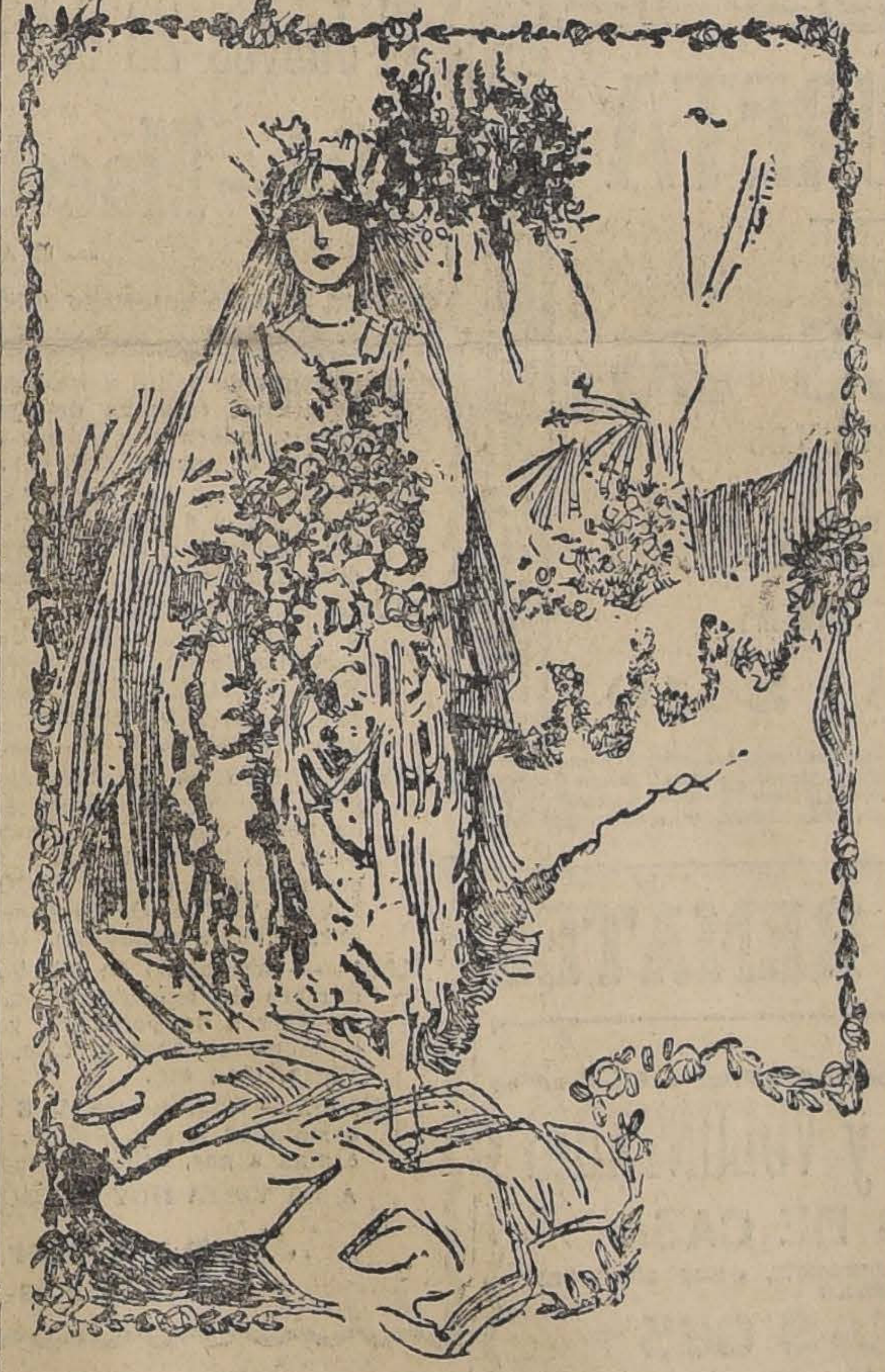
NADIE HUBIERA DICHO DURANTE LA CEREMONIA QUE LA NOVIA LLEVABA MUY OCULTO EN SU PECHO EL PENSAMIENTO DEL DIVORCIO

¿Necesitan abrir zanjas, canales o hacer caminos? ¿Necesitan abrir zanjas, canales o hacer caminos? ¿Necesitan abrir zanjas, canales o hacer caminos?