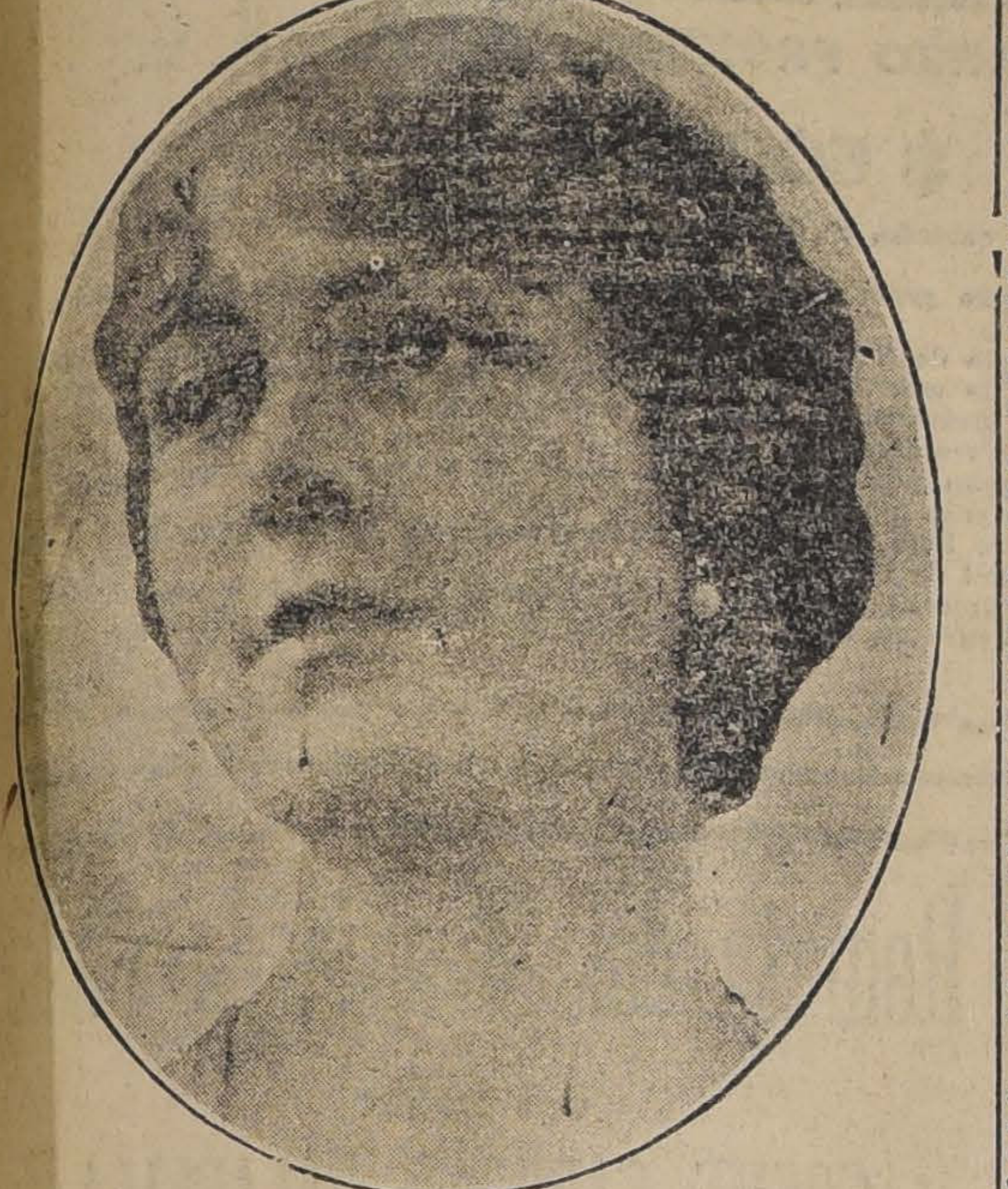
UN RECIENTE RETRATO DE LA PRINCESA

Un telegrama de Londres, daba un resumen de la noticia de que la princesa Radziwiill, hija del príncipe de Polonia, se casó con el príncipe de Serbia, el conde de Castellane. La noticia fue recibida con sorpresa y curiosidad en los círculos sociales de ambos continentes.