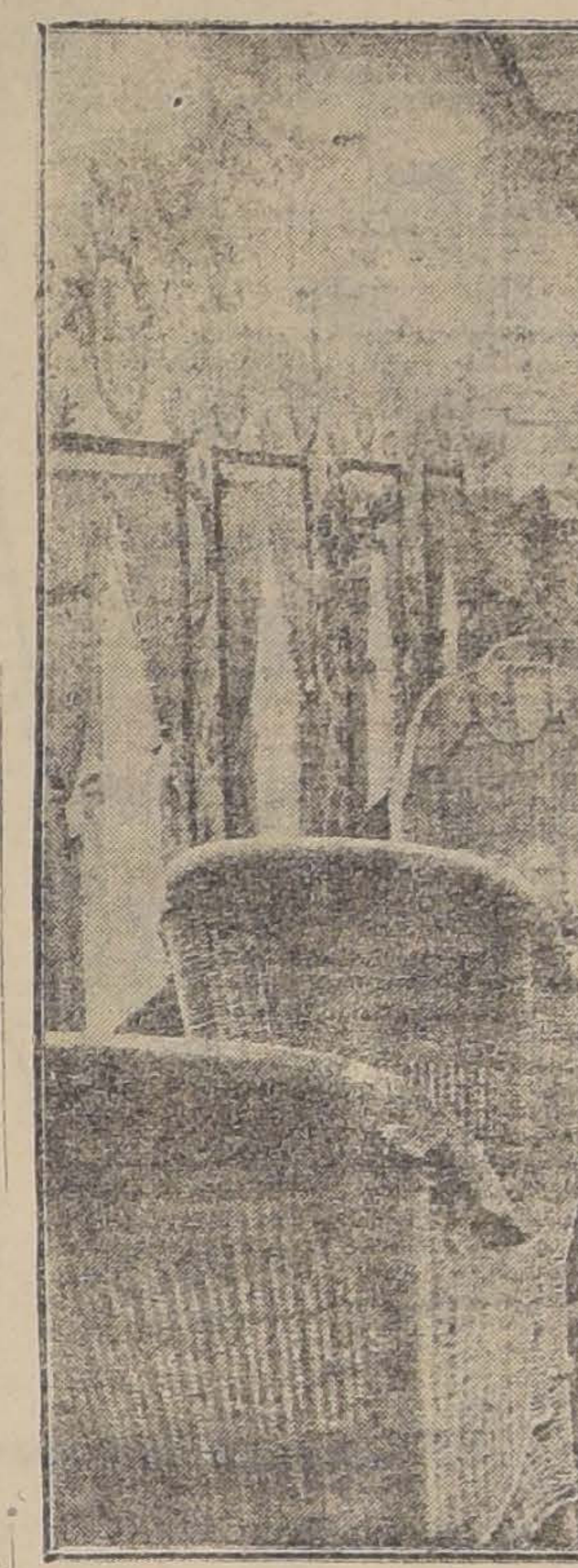
EL INTERIOR DE UN AEROPLANO PARMAN

cas han sido adversas durante 43 días a pesar de lo cual el servicio no se suspendió sino en una sola ocasión, debido a un temporal de una violencia extraordinaria. . . .