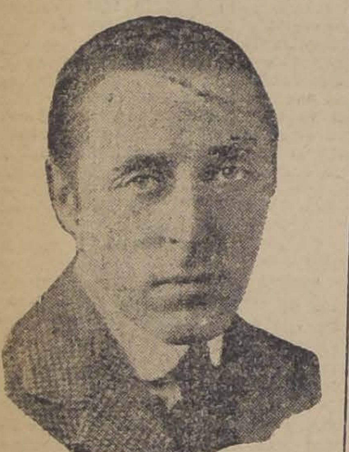
Autor de la gran película "Intolerancia", que hoy estrena en su función nocturna el Splendid

Hoy, a las 9.30 P. M., estrenará el Splendid, la más granada de las funciones de la cinematografía mundial, la obra maestra del genio de la escena muda, del famoso autor de "Corazones del mundo" y "El desmoronamiento de un pueblo", la obra que representa el mayor esfuerzo artístico, económico e histórico no sólo del cine, sino que también del teatro en general, la obra que ha obtenido en todos los países del mundo el éxito más formidable, la que ha causado controversias entre la gente de letras de los países más cultos del mundo, la obra que fue calificada por el Presidente Wilson como la "octava maravilla del mundo": "Intolerancia".