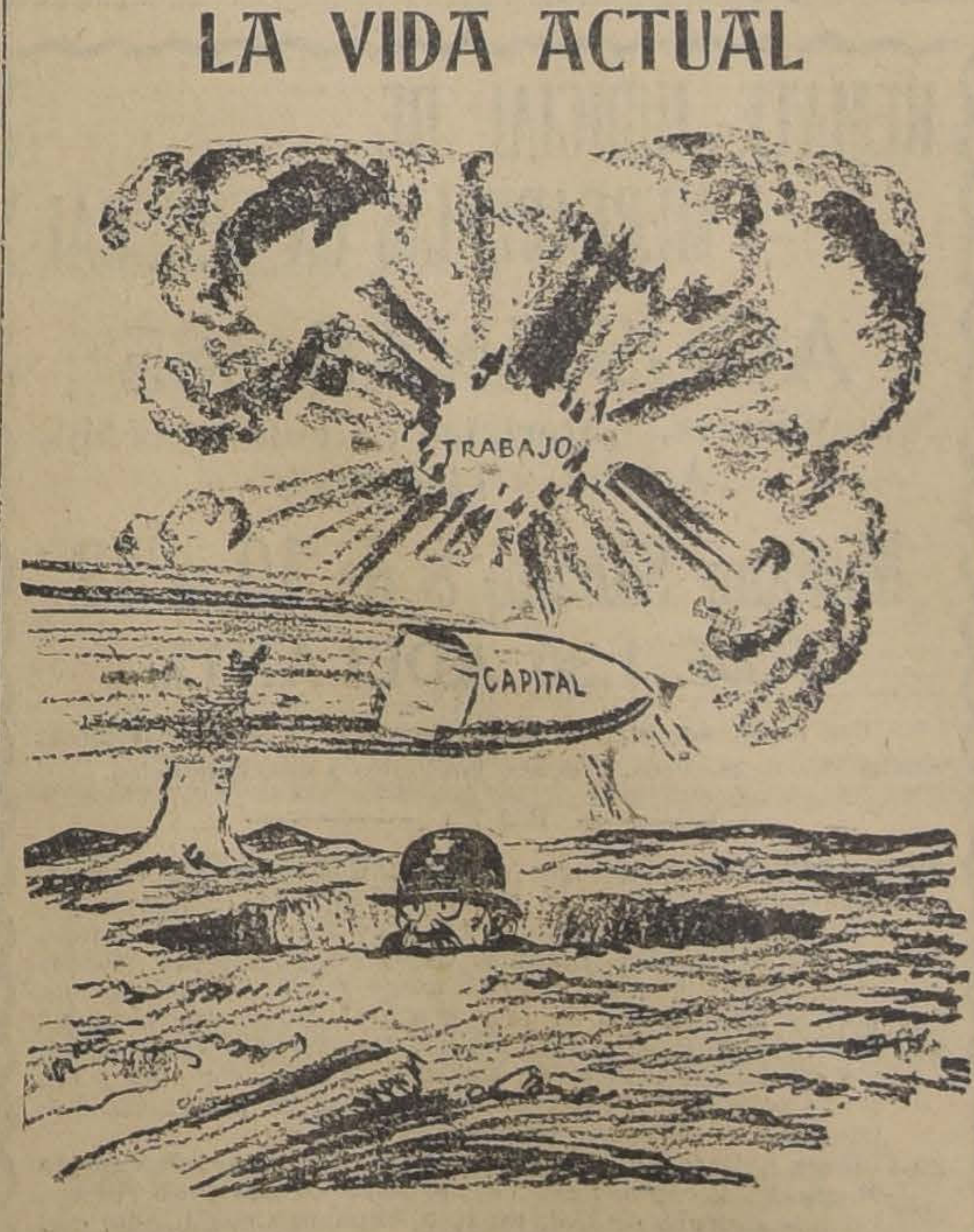
EL PUBLICO: "¡QUE SITUACION TAN AGRADEABLE!"

SOBRE TODOS INGLESES "PICCADILLY" SE IMPONEN POR SU CALIDAD Y PRECIO EXTENSO Y VARIADO SURTIDO Ofrece LA SASTRERIA G. RUDDOFF - 138 - Estado - 138