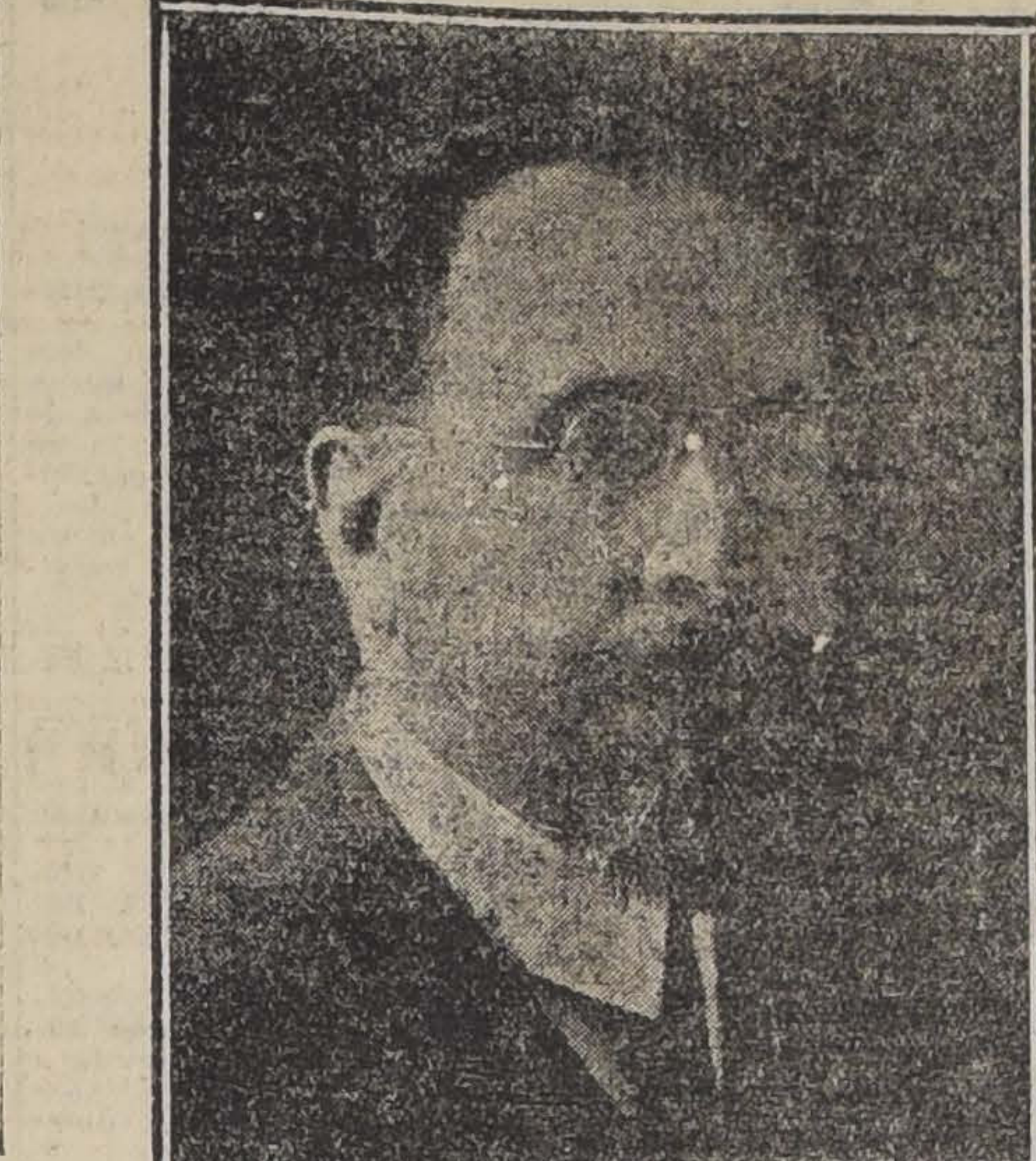
EL SENADOR SEÑOR QUEZADA A QUIEN EL PRESIDENTE ELECTO HA ENCARGADO LA GESTION MINISTERIAL

Se ha citado al Directorio de esta Agragación, para el día Miércoles 8 del presente, a las 8 P. M., en Morandé 460, rogándose llevar los respectivos papeles de adhesión que tienen en su poder.