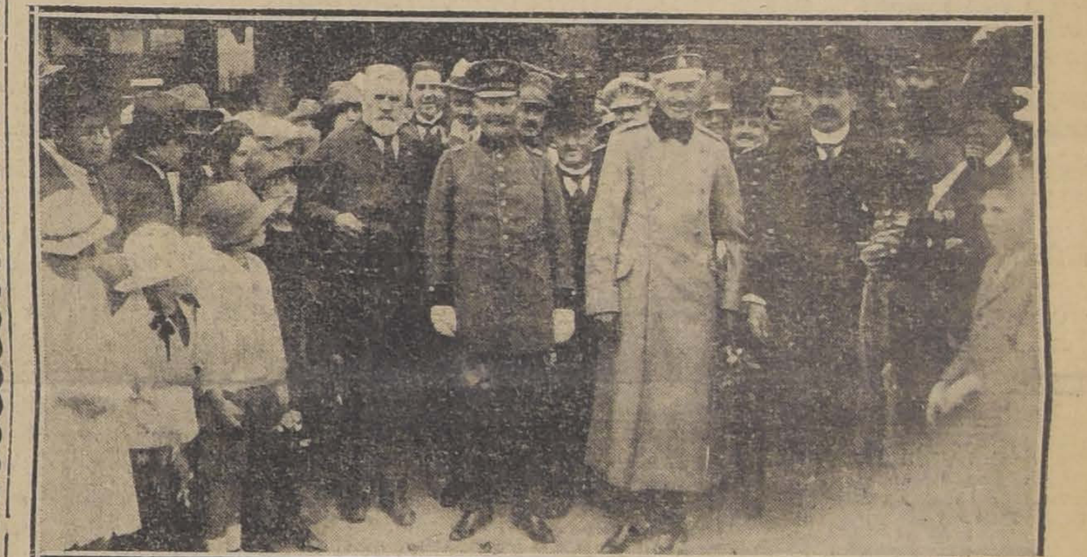
EL INFANTE Y COMITIVA SALIENDO DE LA ESTACION DE OSORNO EN DIRECCION A PUERTO MONTT PARA EMBARCARSE CON RUMBO A MAGALLANES

Después de los festejos de que han sido objeto Su Alteza Real el Infante don Fernando María de Baviera y Borbón y las Embajadas extranjeras a las fiestas de celebración del 40. Centenario del descubrimiento del Estrecho de Magallanes, han partido ayer a la 1. P. M., desde Puerto Montt, con rumbo a los canales del Archipiélago, para continuar el viaje hacia llegar a San Nicolás, donde se reunirán todos los vapores, y seguir después a Punta Arenas.