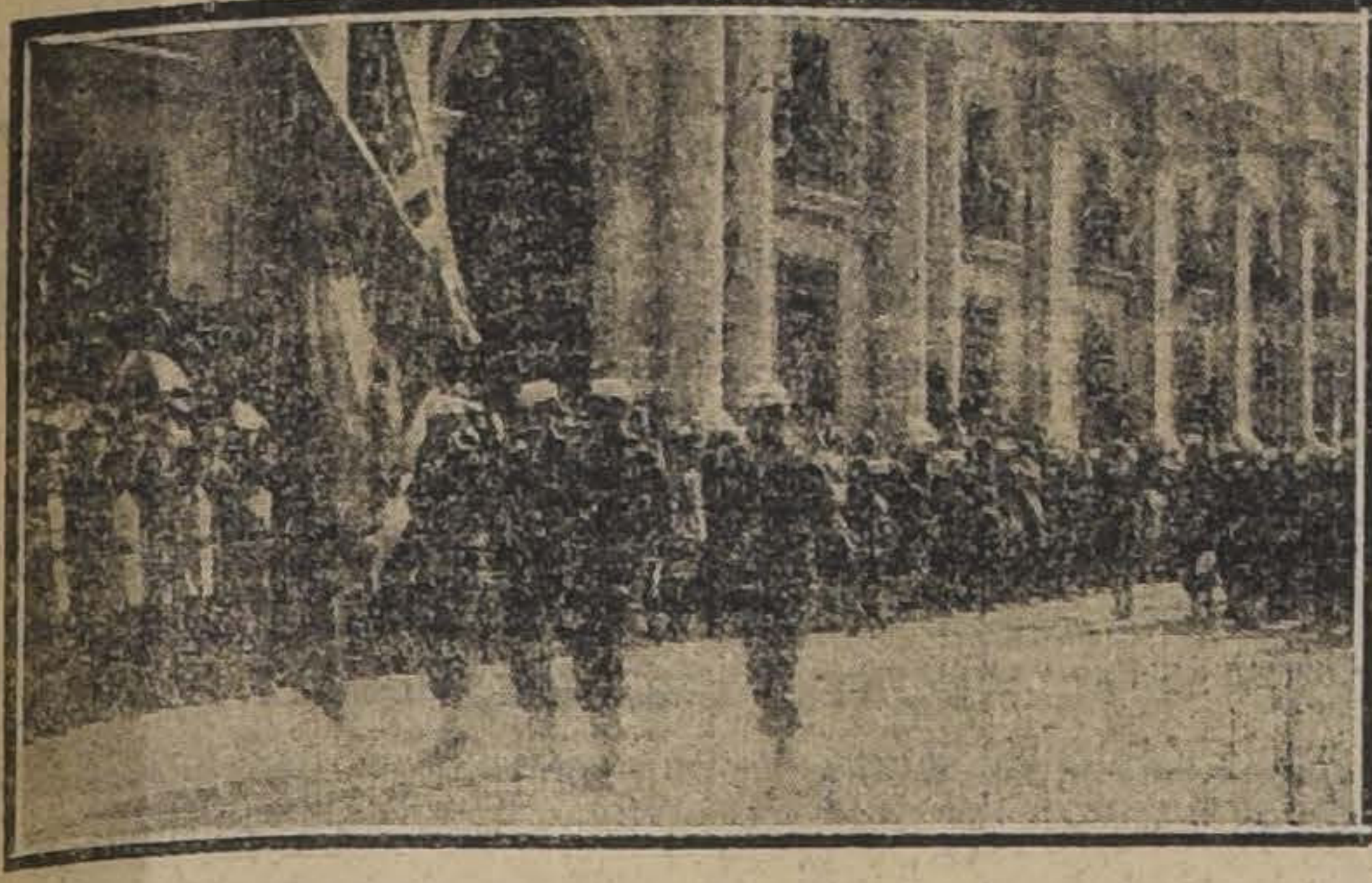
AL INICIARSE EL DESFILE FRENTE A LA MONEDA