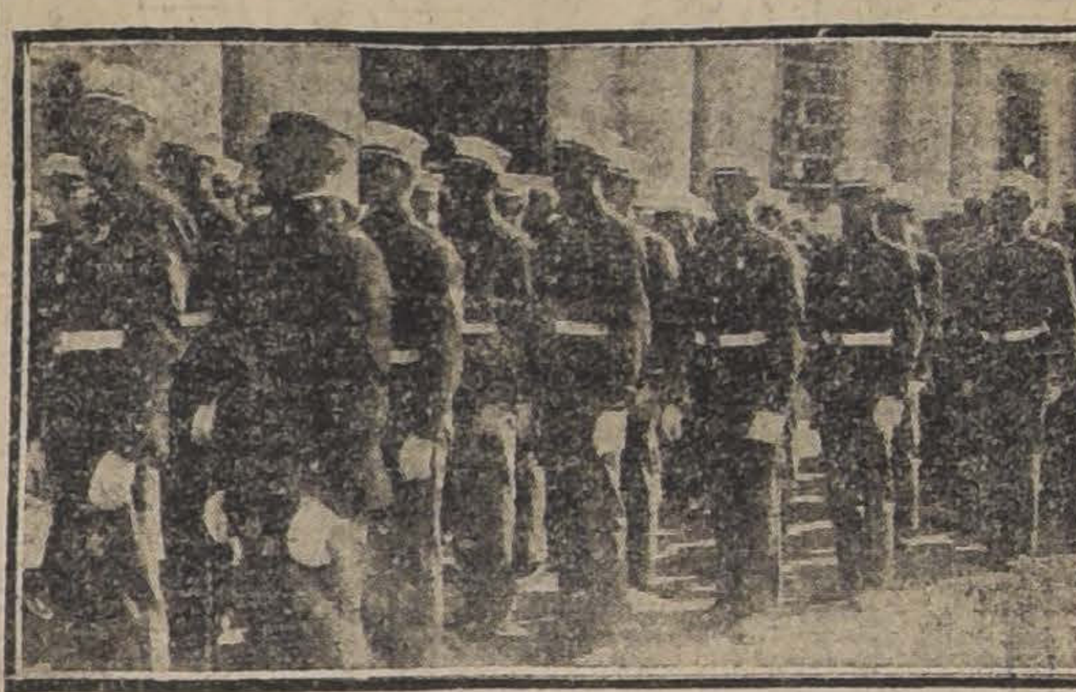
LA COLUMNA FRENTE A LA MONEDA SALUDANDO MILITAREMENTE AL PRESIDENTE DE LA REPUBLICA