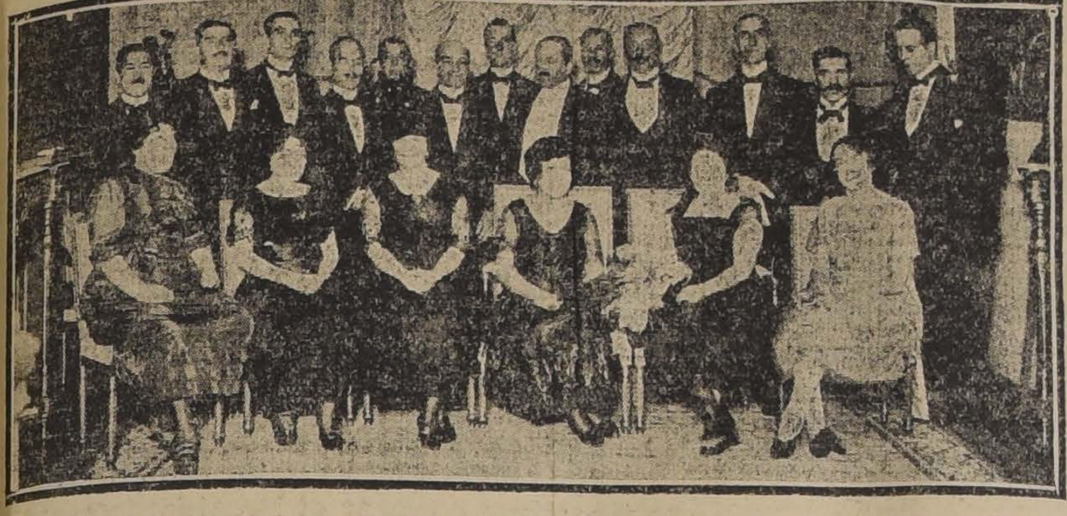
MANUENTE DEL AGREGADO MILITAR ARGENTINO AL CUERPO DIPLOMATICO EMBAJADA AYER EN EL HOTEL SAVOY