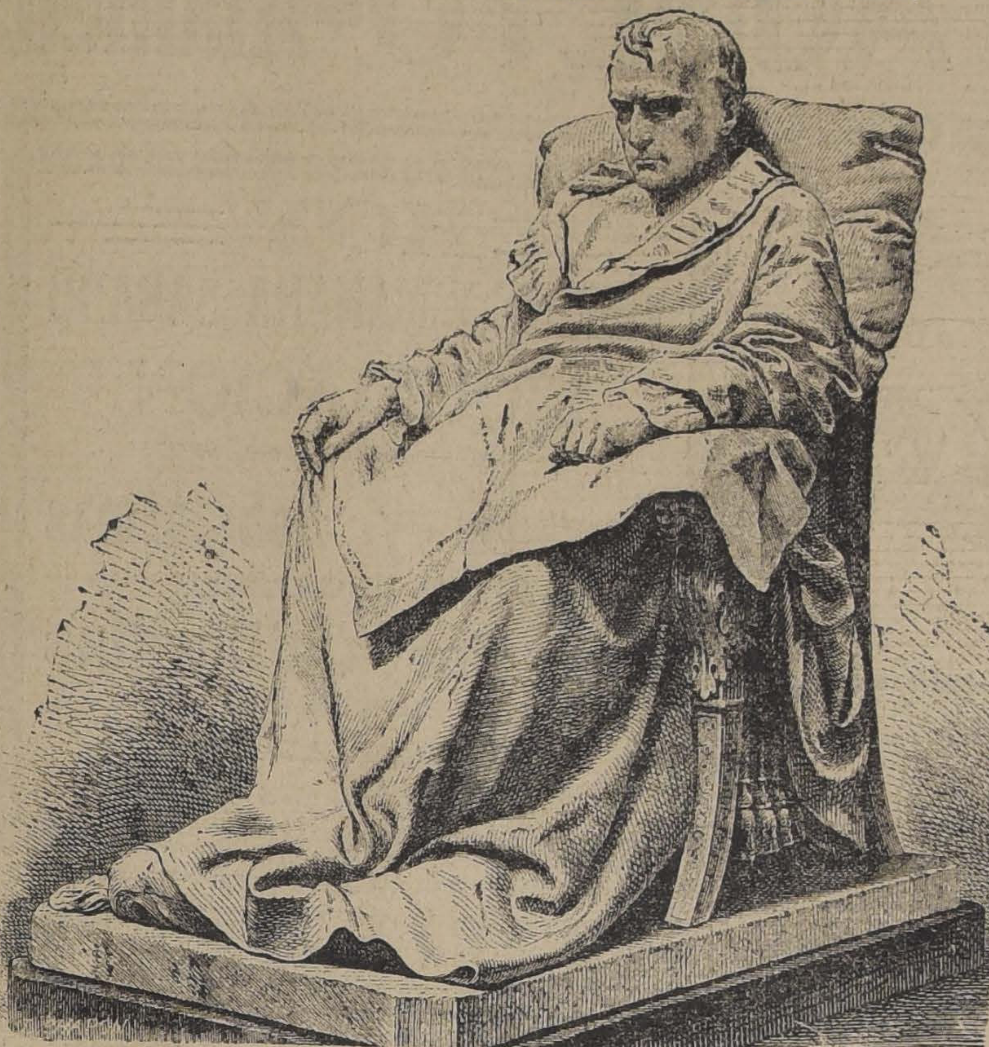
NAPOLEON EN SUS ULTIMOS DIAS

Nada descubre mejor la personalidad íntima de un hombre que sus cartas... hubiera sido una tontería que realizara el más pequeño sacrificio.