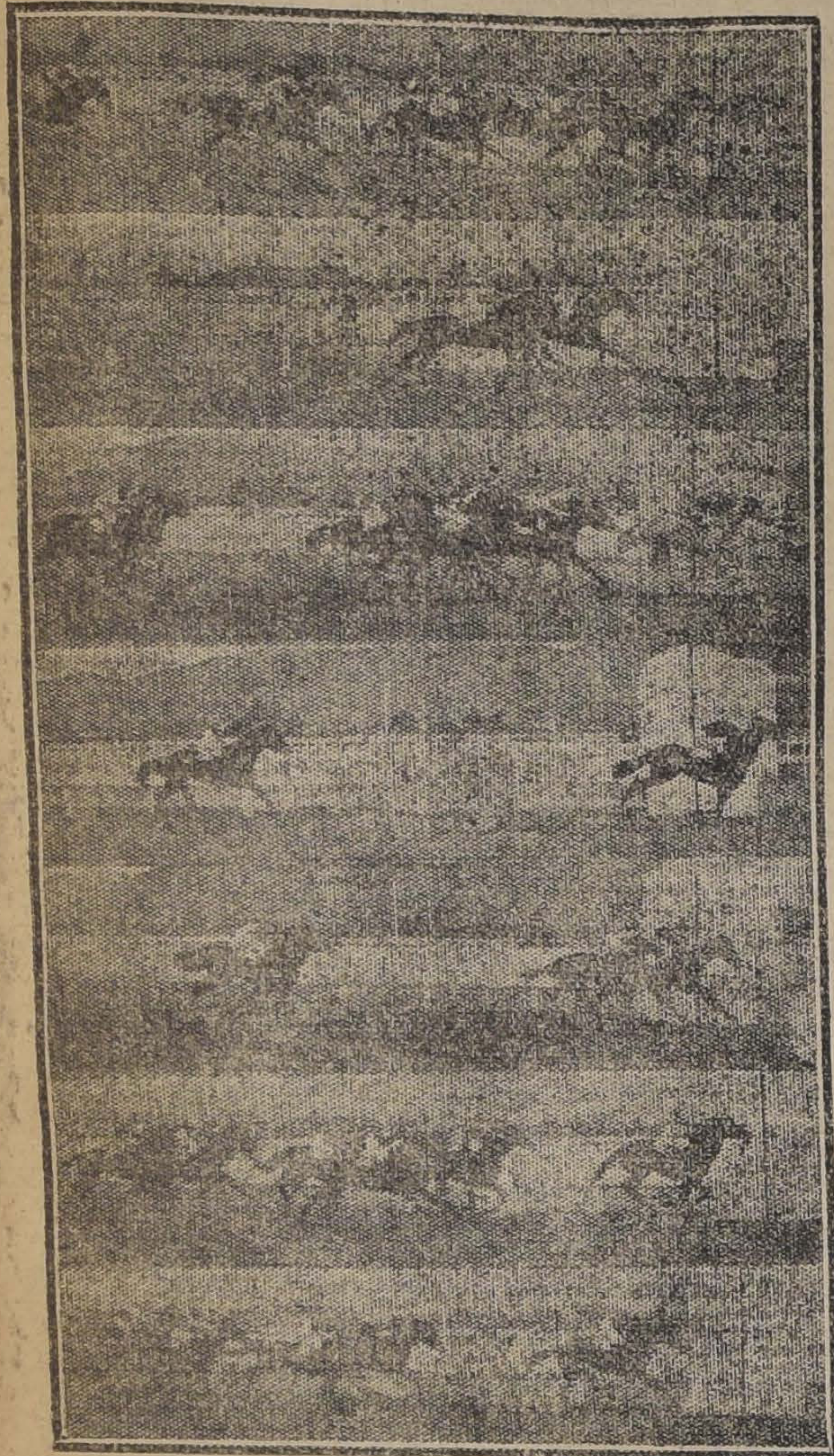
La carrera: Mamadeira, Pochochingue, Djenana, Sardónica. 2.ª Carrera: Cocharquina, Personaje, Catilina, Dándalo. 3.ª Carrera: Mrs. Joe, Alejo II, Pispirita, Dantte Lassie. 4.ª Carrera: Sily, Providencia, Feudal, Pallido. 5.ª Carrera: Toldilla, Berlinicke, Tancredo. 6.ª Carrera: Rabudo, Leoncillo, Ruler, Guayría. 7.ª Carrera: Costanera, Girl, El Controversia, Honolulu.

Pisacero logró aventajar a sus rivales en la partida, viéndose a su siga a Mrs. Yoe, pero sólo le fué posible resistir la atropello de Pispirita, que en los tramos decisivos se hizo presente con bríos y entró a alternar en la competencia en que se empujaron Mrs. Yoe y Alejo II, la que finalizó con el triunfo de la primera por un pescuezo, entrando tercera Pispirita a media cabeza. Cuarto fué Dantte Lassie. Tiempo: 1.7 3/5. Alcijo II a rigor de látigo trató de dar alcance a Mrs. Yoe, pero sólo le fué posible resistir la atropello de Pispirita, que en los tramos decisivos se hizo presente con bríos y entró a alternar en la competencia en que se empujaron Mrs. Yoe y Alejo II, la que finalizó con el triunfo de la primera por un pescuezo, entrando tercera Pispirita a media cabeza. Cuarto fué Dantte Lassie. Tiempo: 1.54 1/5.