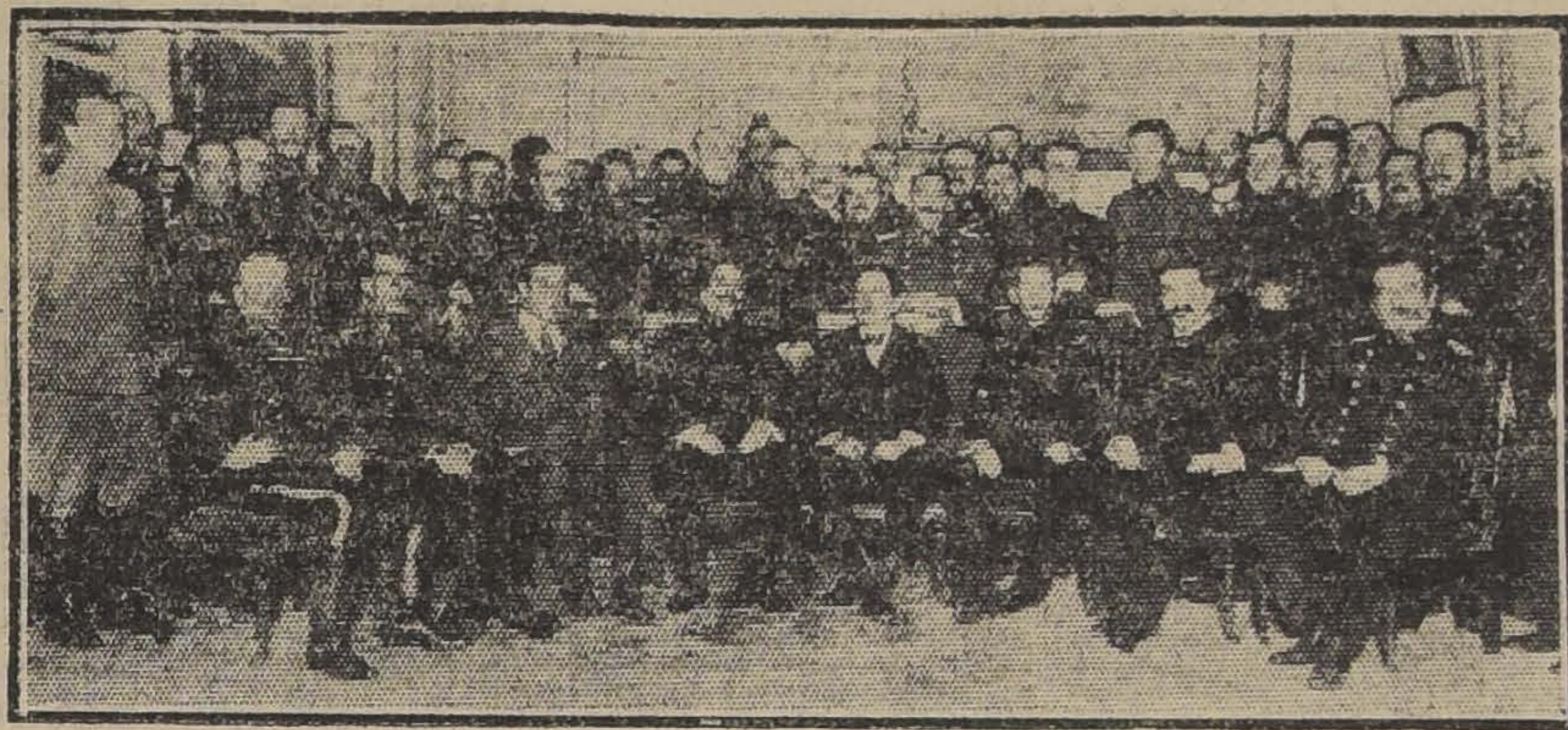
ASISTENTES A LA RECEPCION DE AYER EN EL CLUB MILITAR

merosos amigos, militares y civiles, del festejado.