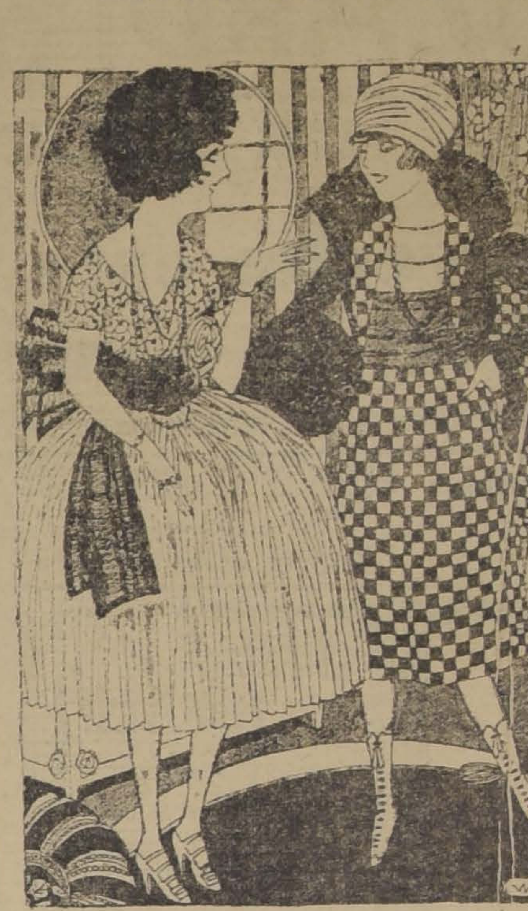
—USTED DEBE HABER TENIDO MUCHOS DISBUSTOS MIEN- TRAS APRENDIA A CANTAR. —MUCHOS... PRINCIPALMENTE CON LOS VECINOS.