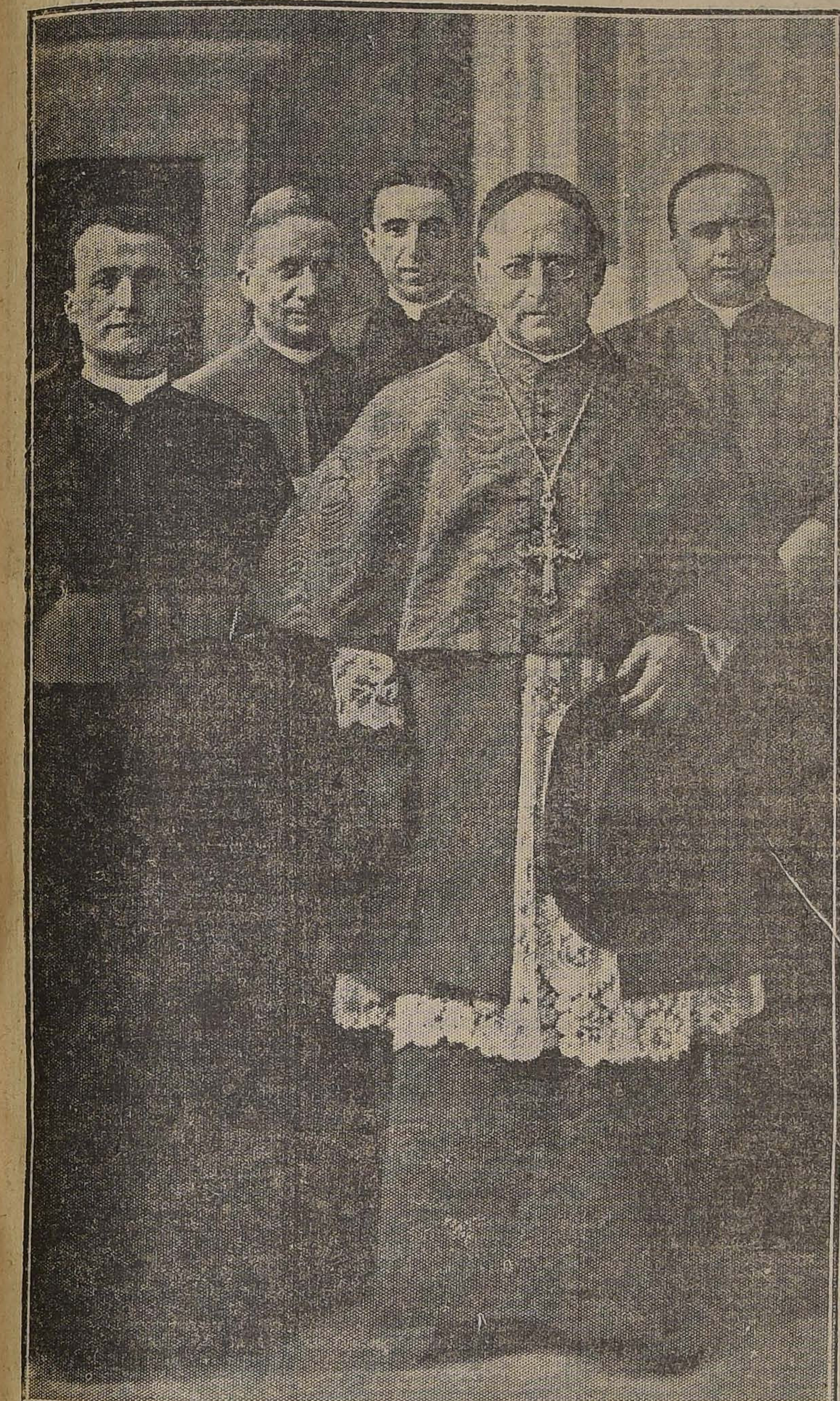
EL CARDENAL RATTI, AL SALIR DEL CONSISTORIO DEL 10 DE JUNIO

ocupar la diócesis de Milán. Vacías de nuestras ilustraciones representan el magno recibimiento que se hizo en la hermosa ciudad lombarda a su ilustre hijo que volvía con el capelo rojo de los cardenales. Grandes muchedumbres se agolparon para aclamarlo, y su llegada tuvo todos los caracteres de una entrada triunfal. El Duomo se iluminó aquella noche con una fantástica luminaria, y el pueblo llenó la vasta plaza de la Catedral hasta muy tarde de la noche.