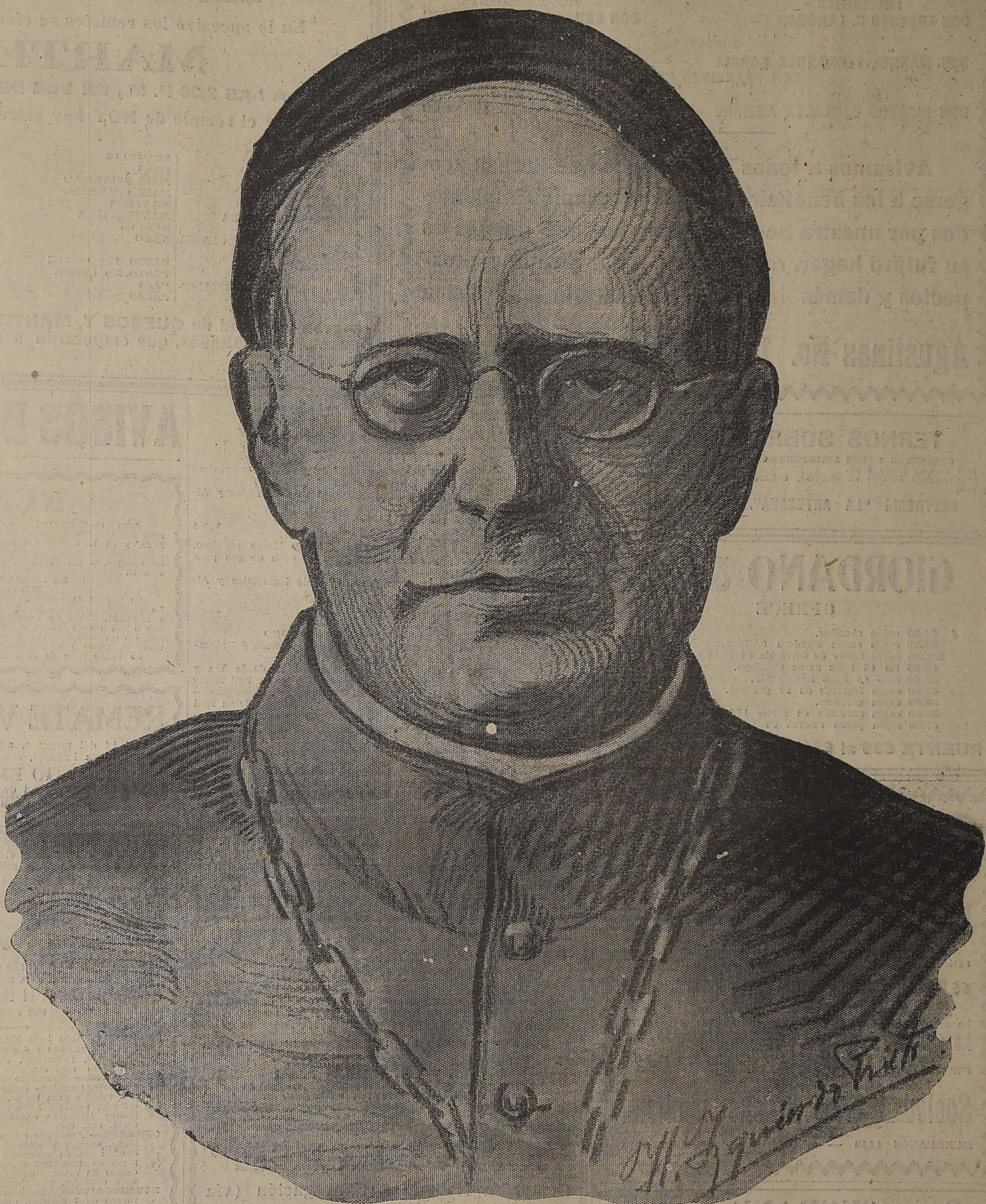
SU SANTIDAD PIO XI

La viva ansiedad que se había apoderado de todo el mundo católico ante la elección del Sumo Pontífice que había de suceder a Benedicto XV, ha sido satisfecha ayer en la mañana con la noticia que el cable transmitió en unos cuantos minutos por todo el orbe, indicando que el Sacro Colegio había elegido su misión electiva.