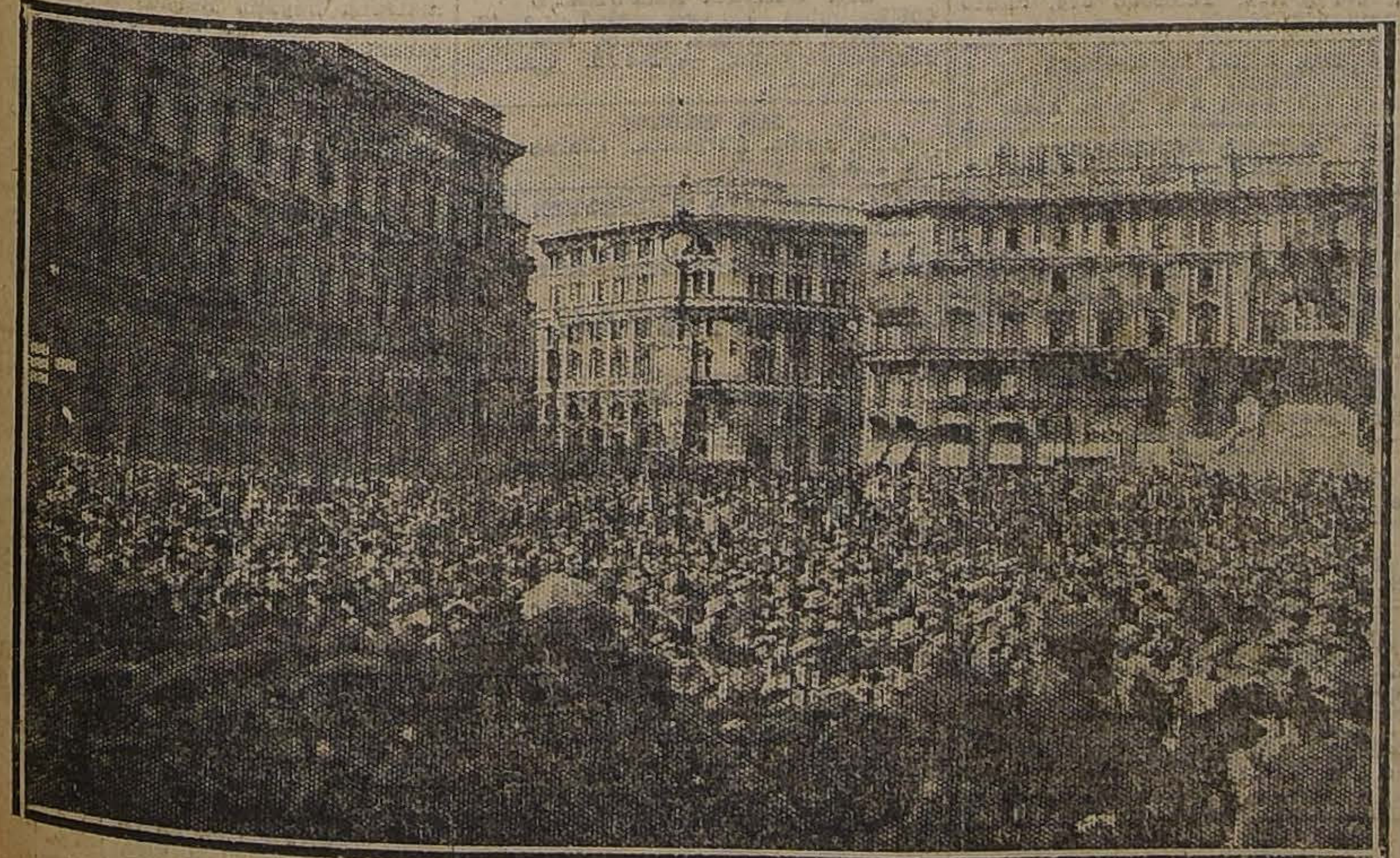
CONSAGRACION DE MONSEÑOR RATTI COMO ARZOBISPO DE MILAN. — LA ENORME MUCHEDUMBRE EN LA PLAZA DEL DUOMO