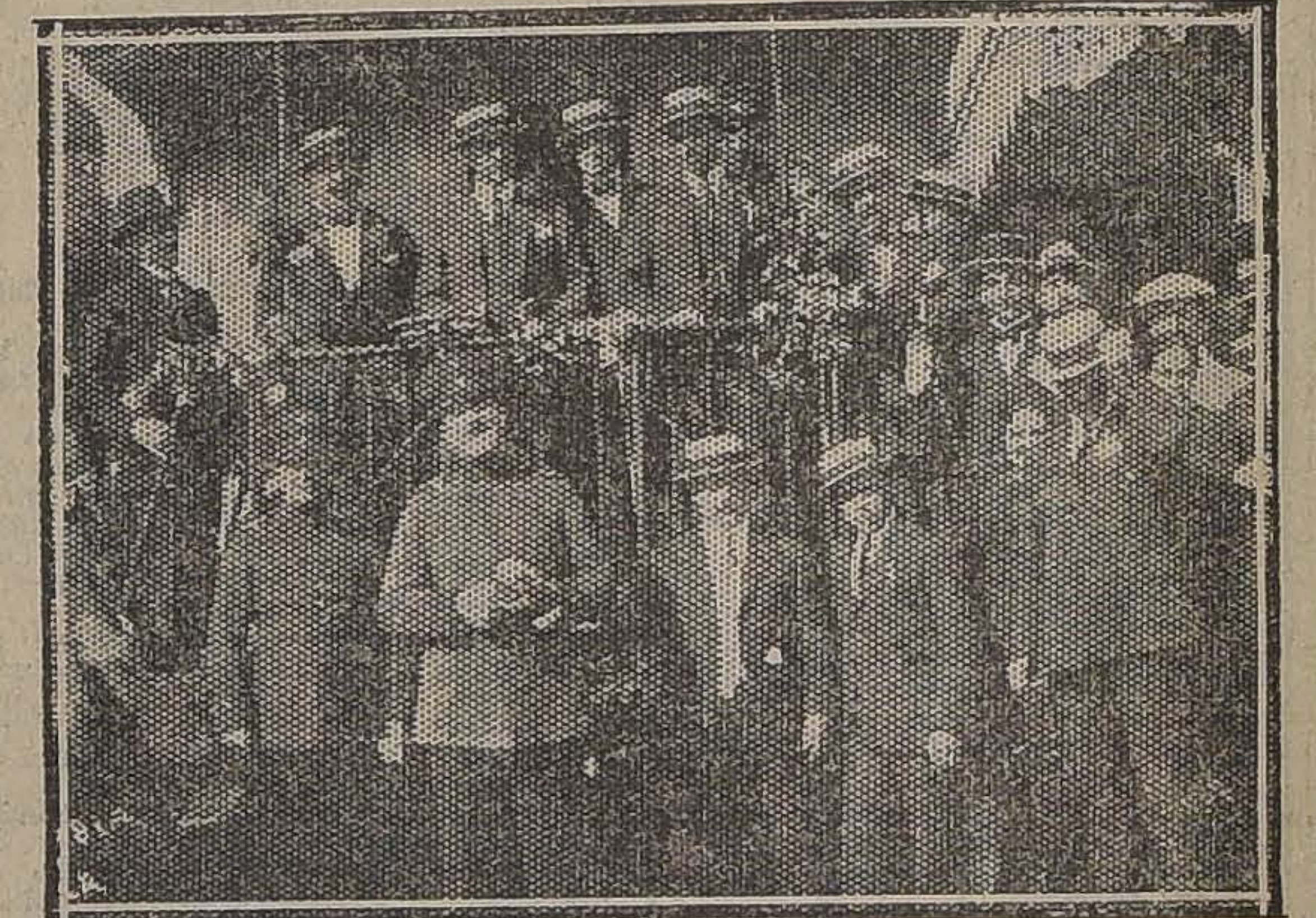
ARICA. — EL CANCELIER ES DESPEDIDO EN LA ESTACION, EN EL MOMENTO DE PARTIR A TACNA