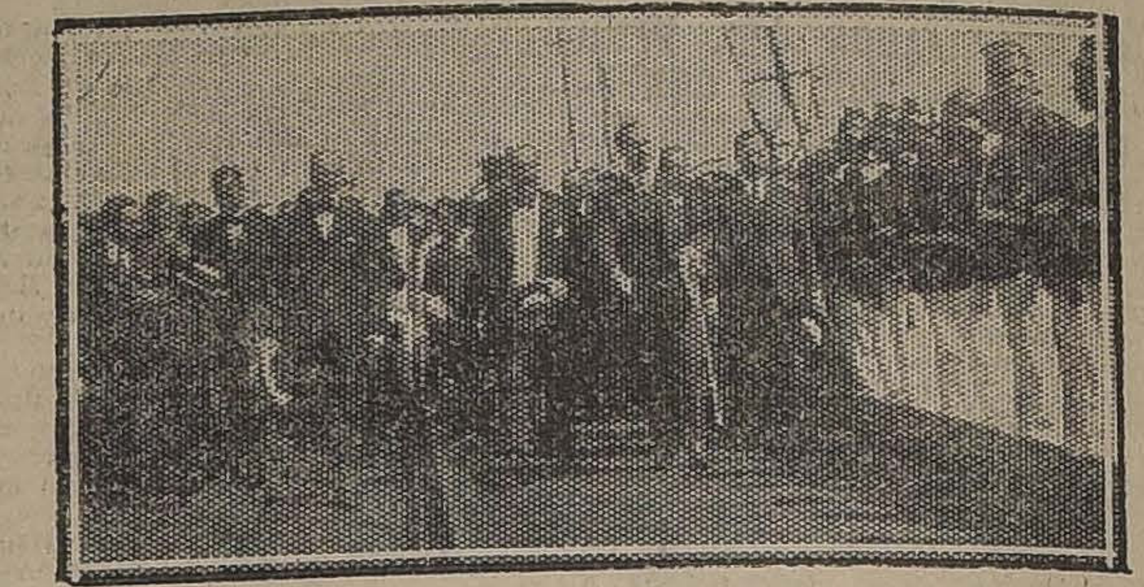
ARICA. — EL MINISTRO SEÑOR BARROS JARPA, ACOMPAÑADO DE LAS AUTORIDADES DE TACNA Y ARICA, REVISTIA AL DESEMBARCAR AL CUERPO DE BOMBEROS