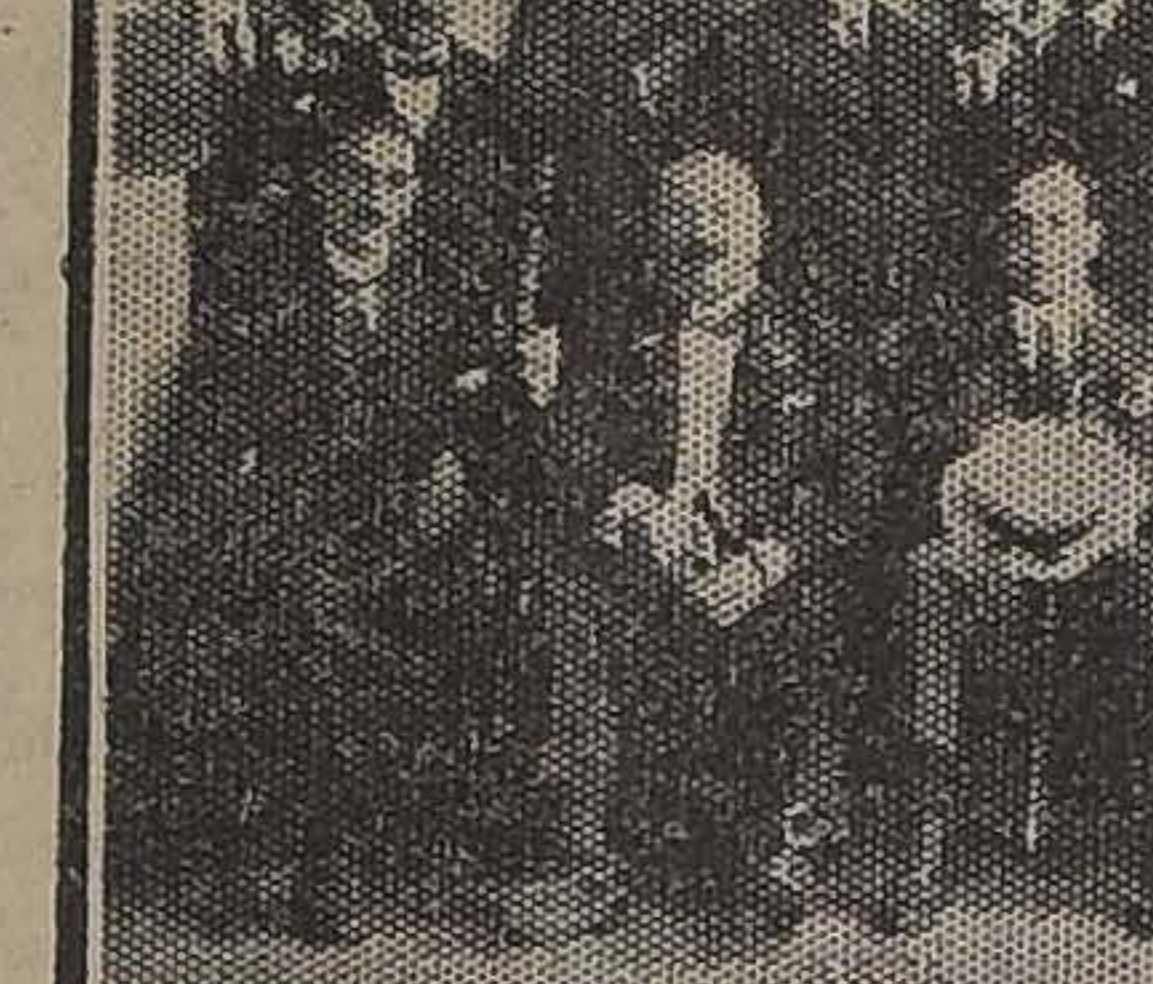
EN LA GOBERNACION DE ARICA, EL CANCELIER RODEADO POR LAS AUTORIDADES DE PARTAMENTALES