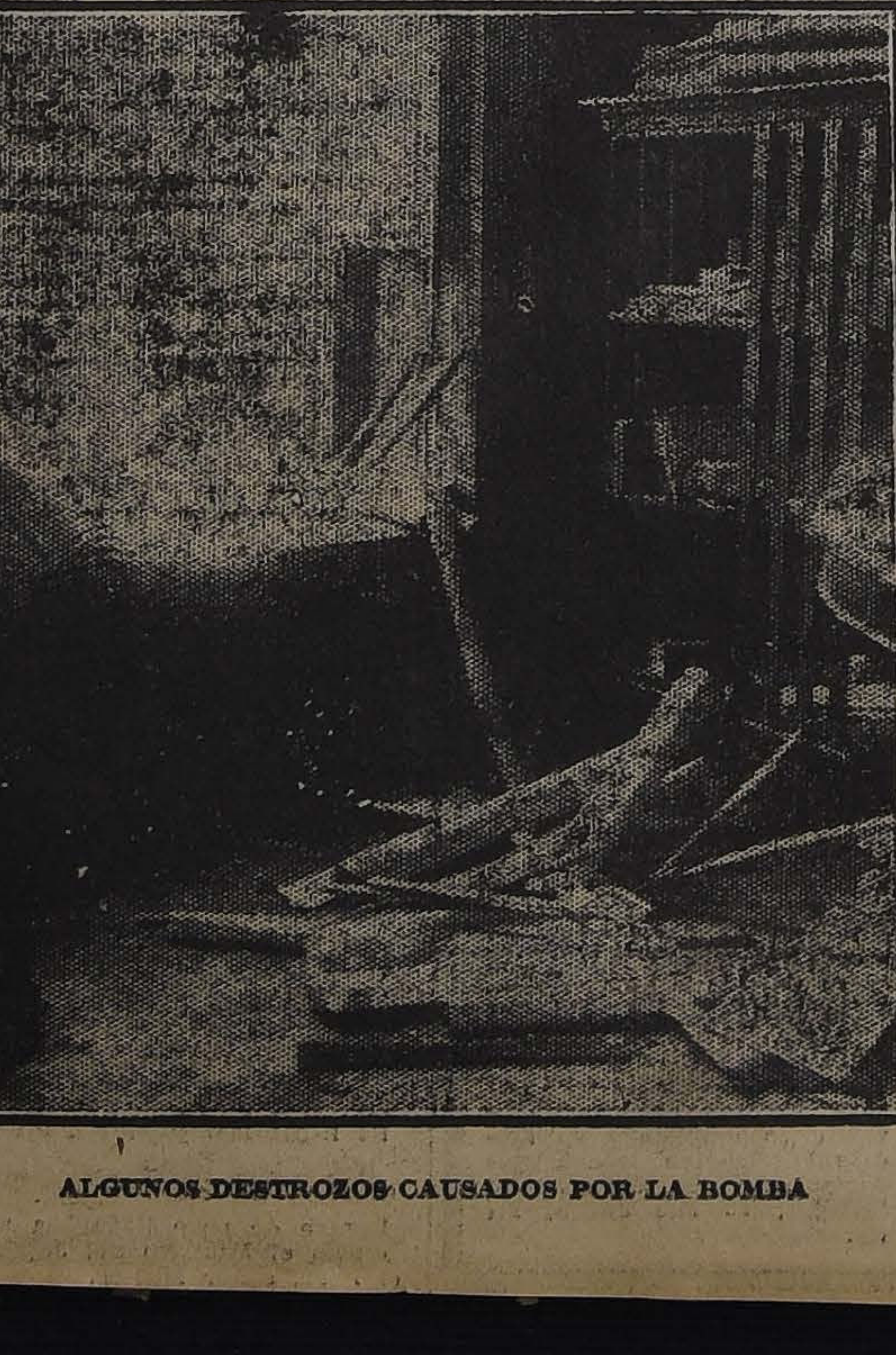
ALGUNOS DESTROZOS CAUSADOS POR LA BOMBA