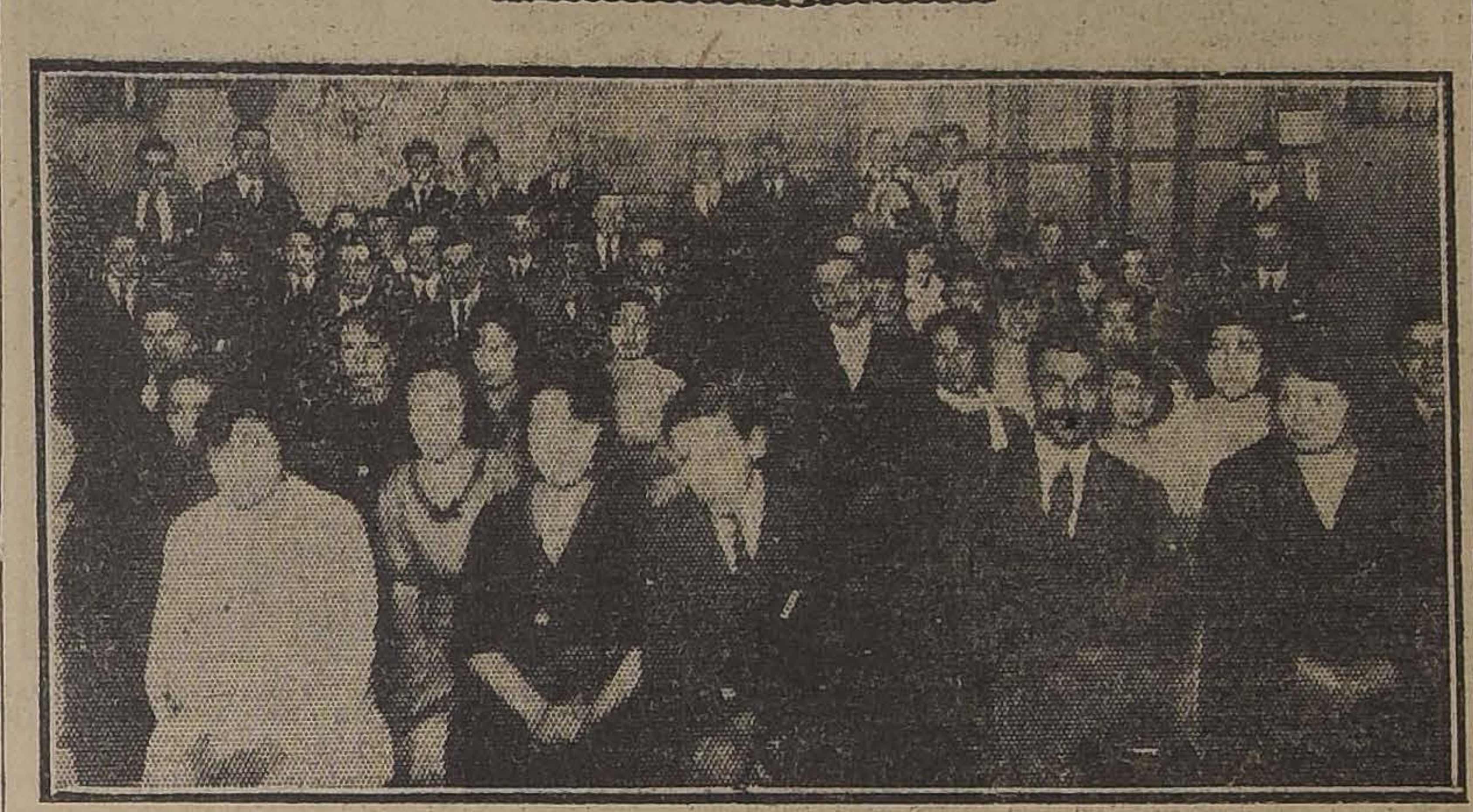
GRUPO DE ASISTENTES A LA VELADA DE ANOCHE EN EL CENTRO ESTUDIO Y PROGRESO

Con todo éxito se verifica anoche la velada organizada por el Centro Estudio y Progreso