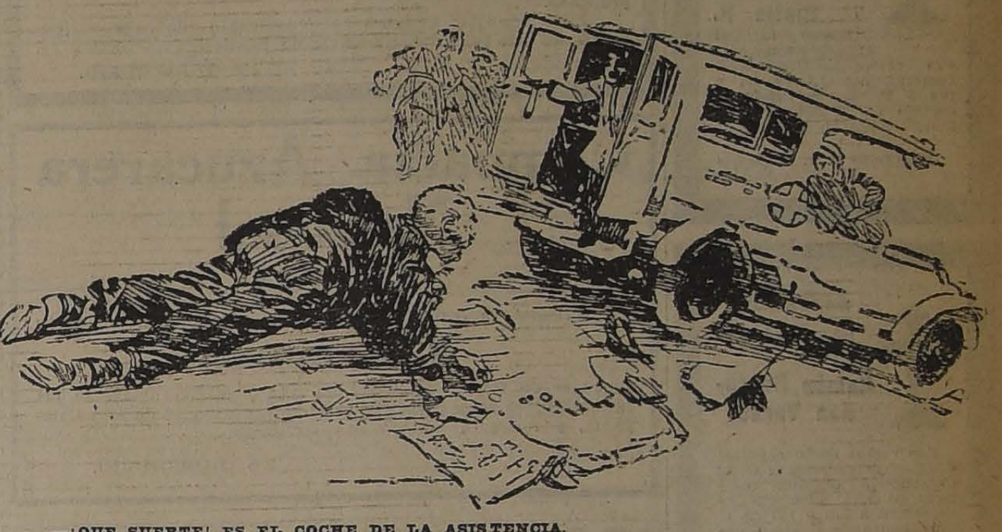
—QUE SUERTE! ES EL COCHE DE LA ASISTENCIA.

la había conocido en una reunión social y su conocimiento no había hecho sino completar la impresión que le habían producido sus artículos y relatos aventureros. Hay que advertir, además, que Andreivitch había simpatizado en una forma muy marcada con Mrs. Stephens. Una simpatía mutua y muy afectuosa se había producido entre ambos y se buscaban y se reunían en los salones donde eran invitados. Sin embargo, los millones eran un molesto obstáculo para darle a este amor una decoración despojada de toda sospecha. Así lo comprendió el joven oficial y así también lo comprendía con mayor tormento Mrs. Stephens. La solución tenía que venir y traería un amor verdadero. En efecto, Andreivitch se trasladó a Estados Unidos y sentó plaza en una de las grandes usinas de Filadelfia, donde está actualmente estudiando la fabricación de locomotoras, y desde acá llamó a Mrs. Stephens, quien ha venido a unirse al joven oficial después de haber distribuido su cuantiosa fortuna en diversas obras de beneficencia y otros legados. Ahora ambos están viviendo en una humilde vivienda de los alrededores de Filadelfia, felices de haber podido triunfar de la ambición y de las grandes tentaciones de una gran fortuna.