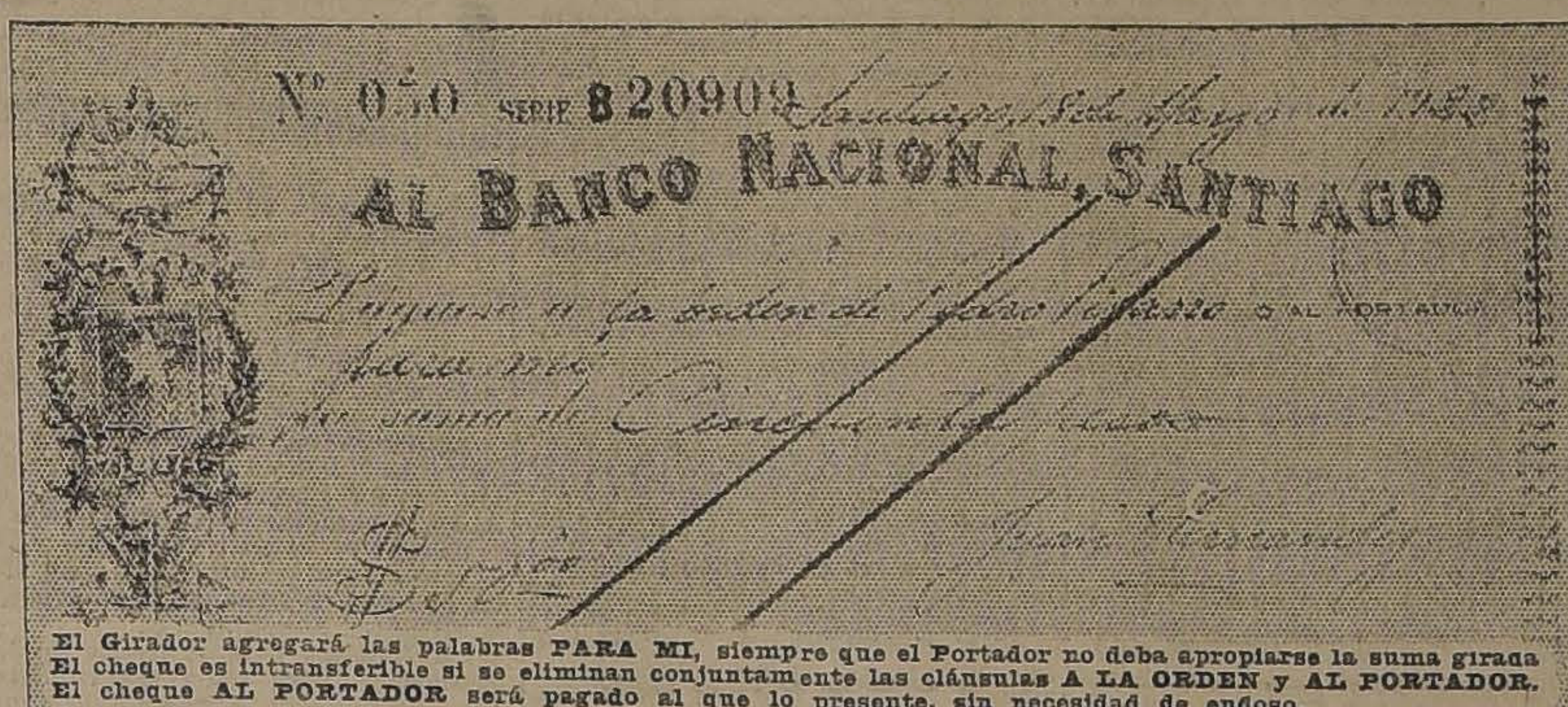
El Giro: agregará las palabras PARA MI, siempre que el Portador no deba apropiarse la suma girada. El cheque es intransferible si se eliminan conjuntamente las cláusulas A LA ORDEN Y AL PORTADOR.

PARTIDO DEMOCRATA. CENTRO DEMOCRATA DE SANTIAGO. Se ha citado a la sesión ordinaria del jueves próximo, con el objeto de ocuparse de importantes asuntos de actualidad política, entre otros de la próxima elección municipal por Santiago y de la actitud que corresponda adoptar al Partido.