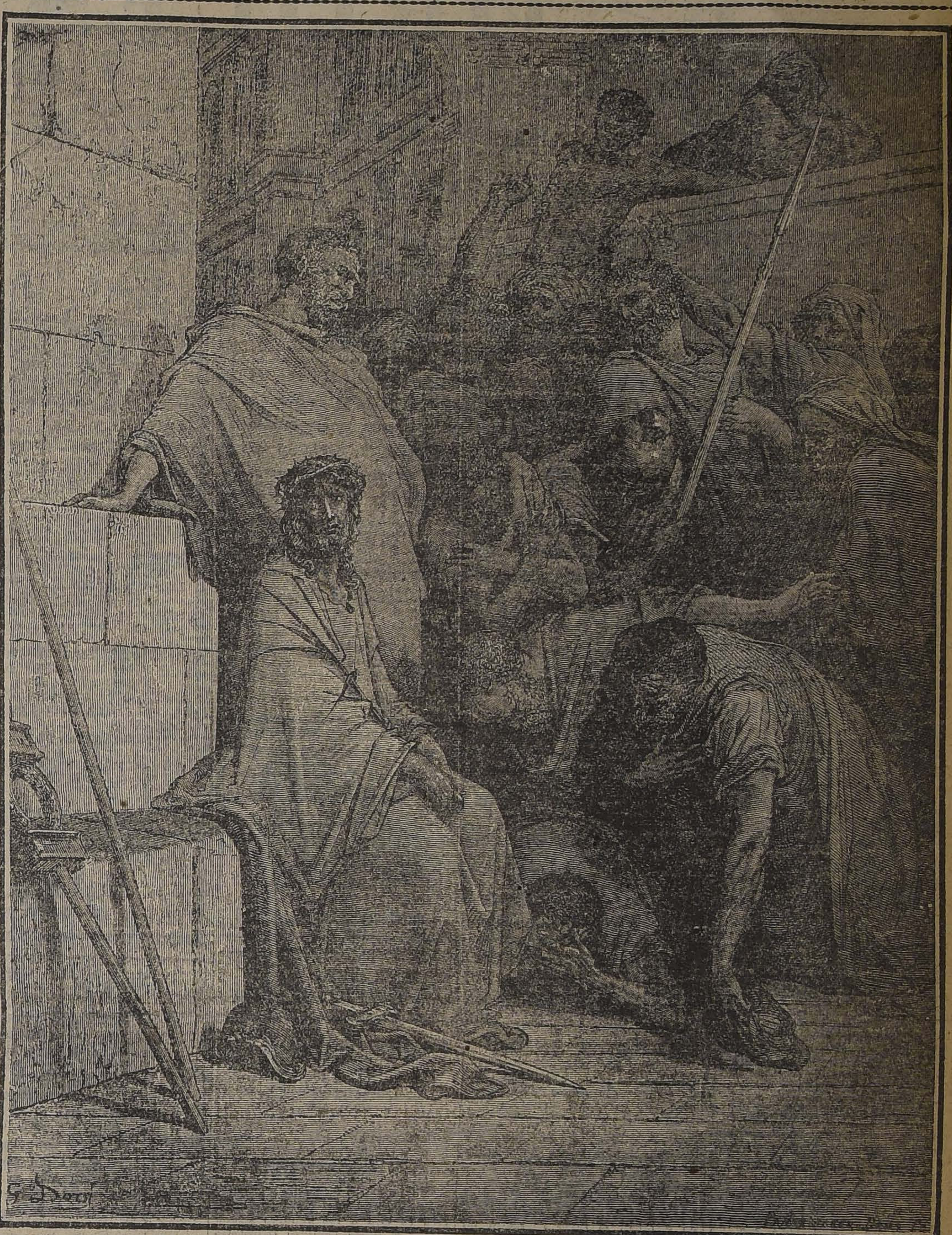
62.—Y saliendo fuera Pedro, lloró amargamente. 63.—Y los hombres que tenían a Jesús se burlaban de él, hiriéndolo. 64.—Y cubriéndolo, herían su rostro, y preguntábanle, diciendo: "Profetiza quién es el que te hirió". 65.—Y decían muchas otras cosas injuriándole". SAN LUCAS, Cap. 22.