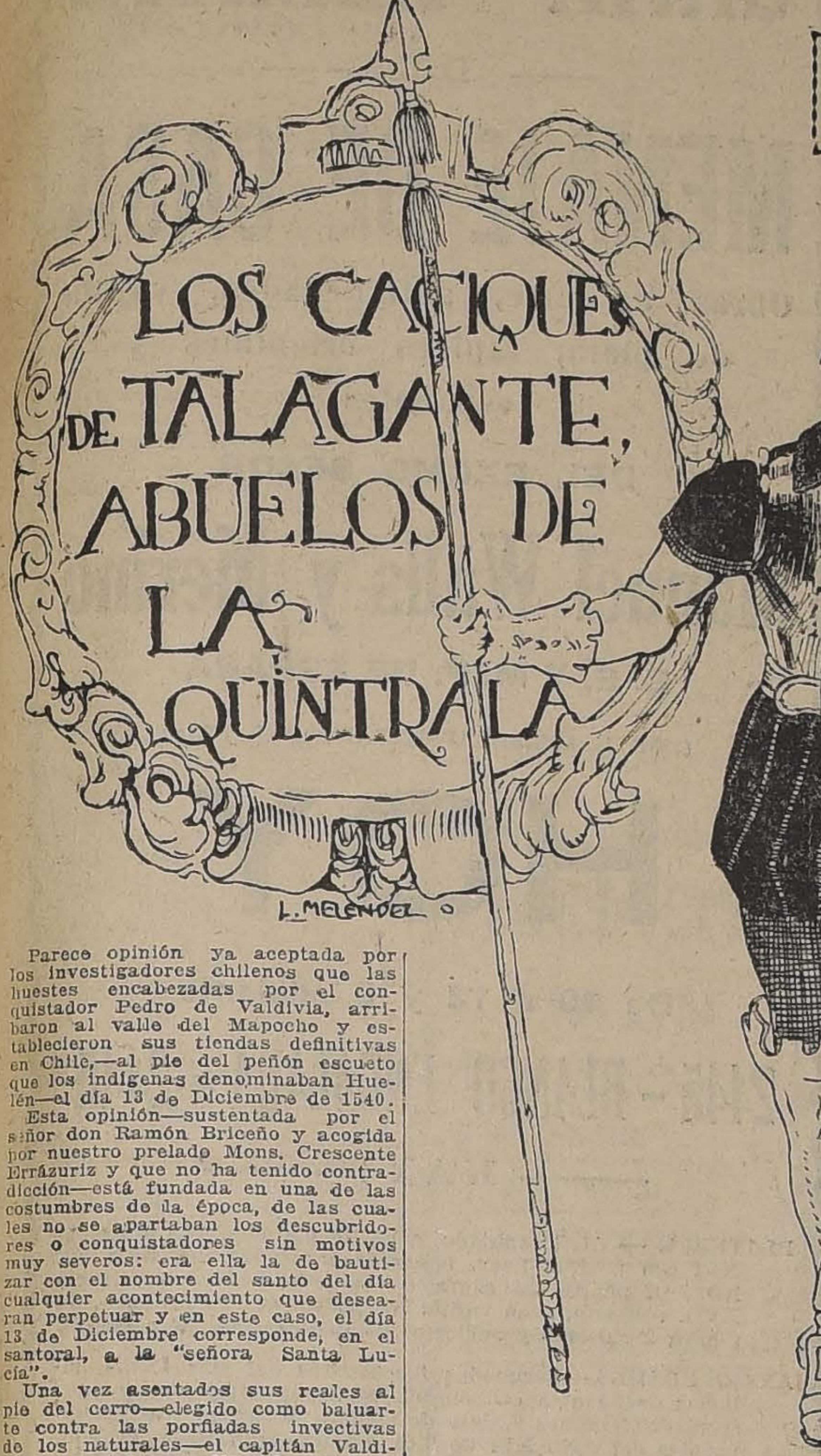
LOS CACIQUES DE TALAGANTE, ABUELOS DE LA QUINTRALA

Agueda Flores, hija de la cacica de Talagante, contrajo matrimonio con Bartolomé Flores, con el Capitán alemán Pedro Lisperguer, y una hija de este matrimonio, que fue feo, llamado Catalina Flores y Lisperguer, casó con el General Gonzalo de los Ríos y Encio, de donde arranca el tropico de doña Catalina de los Ríos y Flores, la Quintrala.