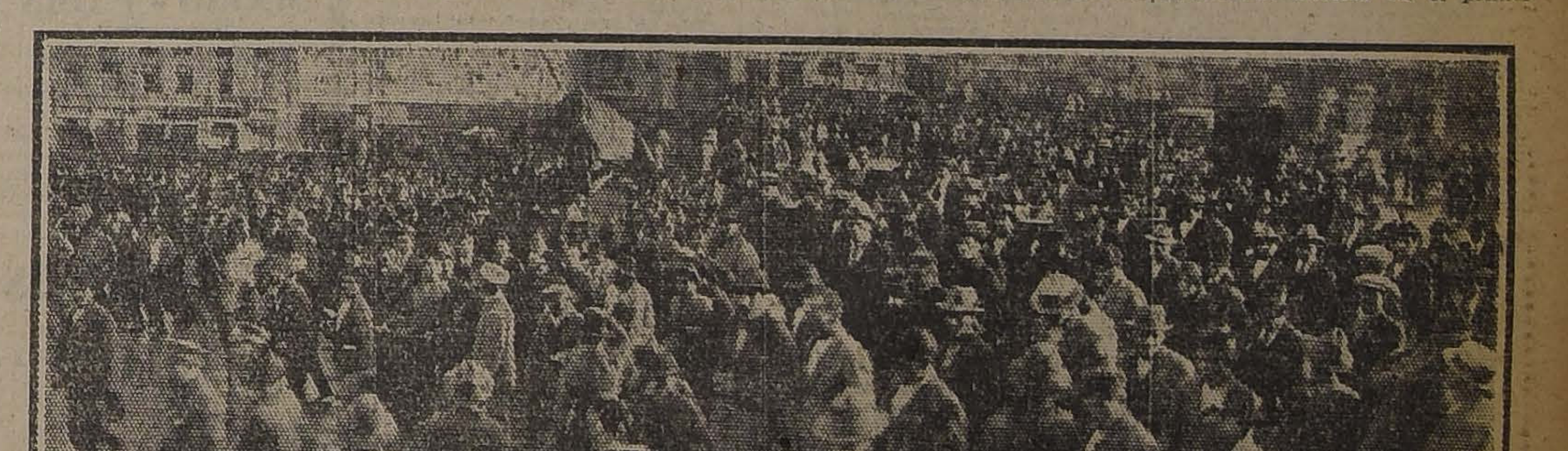
DURANTE LOS FUNERALES DEL OBRERO ROMERO