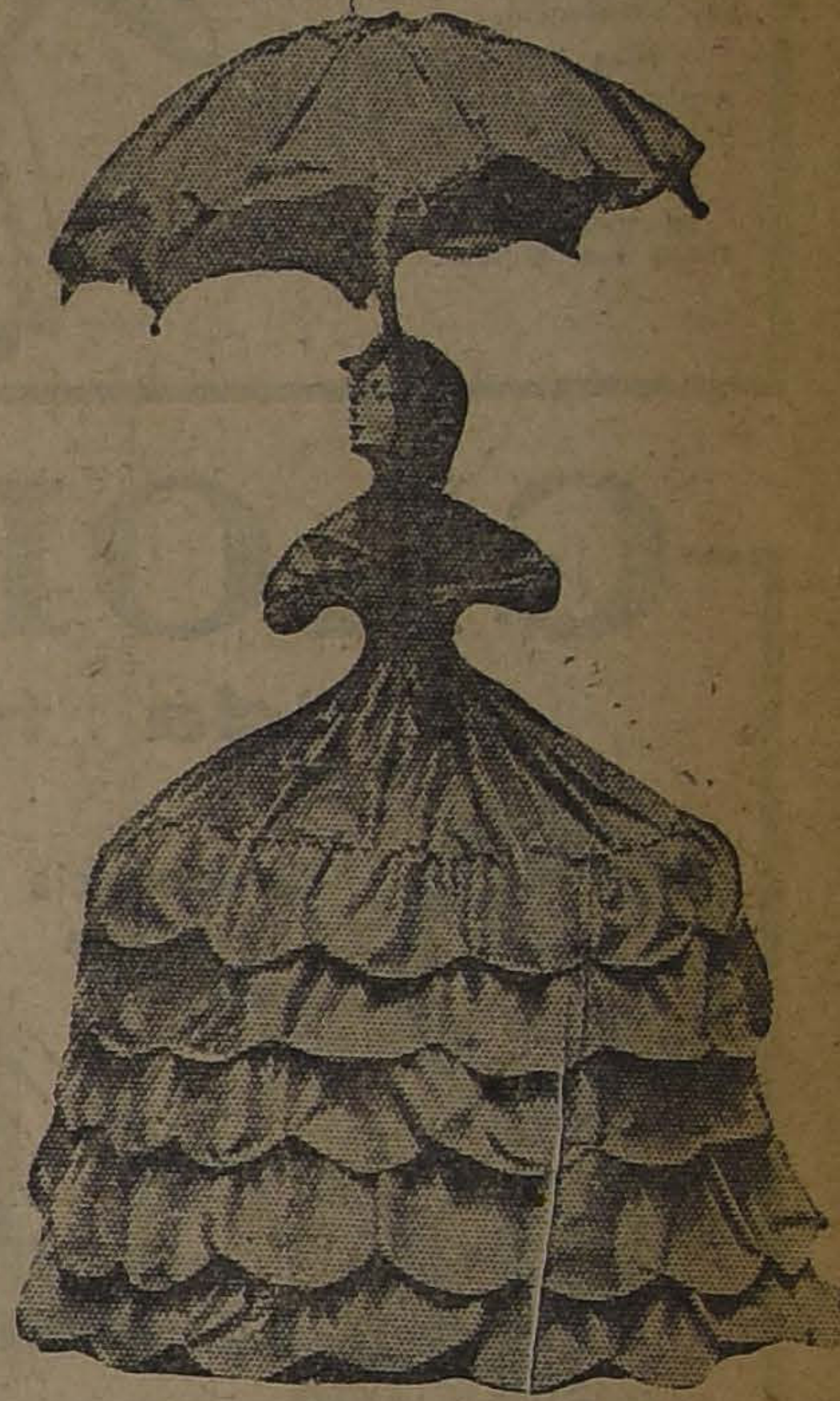
A LA IZQUIERDA: MUÑECA QUE SIRVE DE LAMPARA Y COSTURERO. — AL CENTRO: UNO DE LOS NUEVOS SACOS DE MANO. — A LA DERECHA: UNA MUÑECA LU-

MINOSA. HAY UNA AMPOLLETA EN LA SOMBRILLA Y OTRA EN EL VESTIDO.