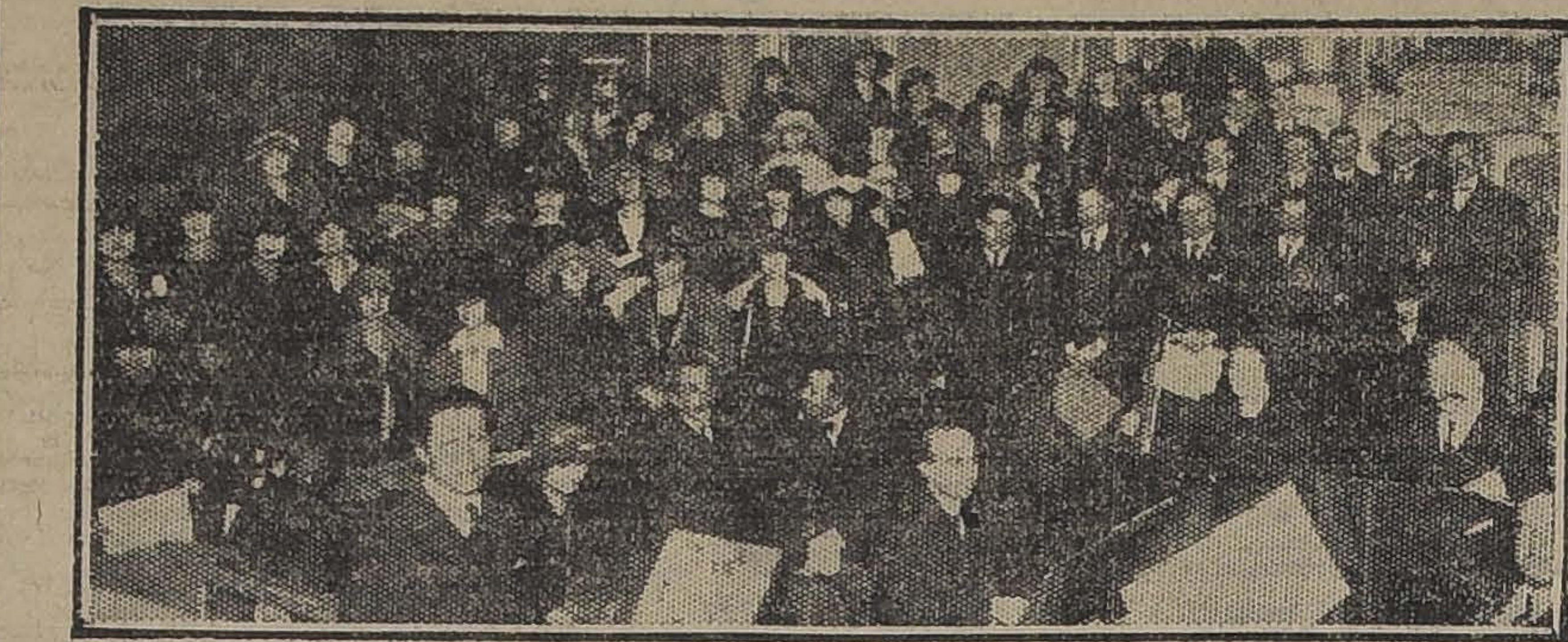
DURANTE EL ENSAYO DE AYER DE LA MISA

En la tarde de ayer se efectuó en la Catedral el ensayo general de la Gran Misa Eucarística que distinguieron señoras, señoritas y jóvenes de nuestra sociedad cantarán el Miércoles 6 de Septiembre