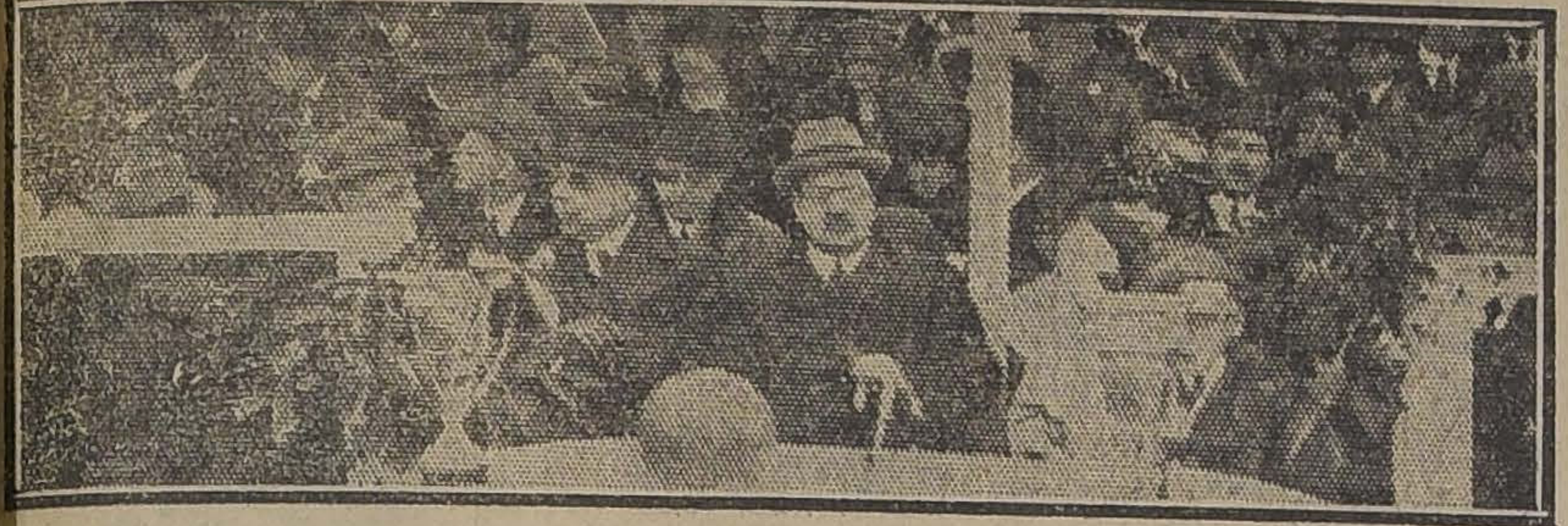
LA TRIBUNA DE HONOR DE LA GRAN FIESTA

hacían emplearse seriamente a la zaga adversaria. Los frecuentes cornetas que se vio obligado a ceder el equipo español, no dieron mayor resultado por la desviación de los tiros finales.