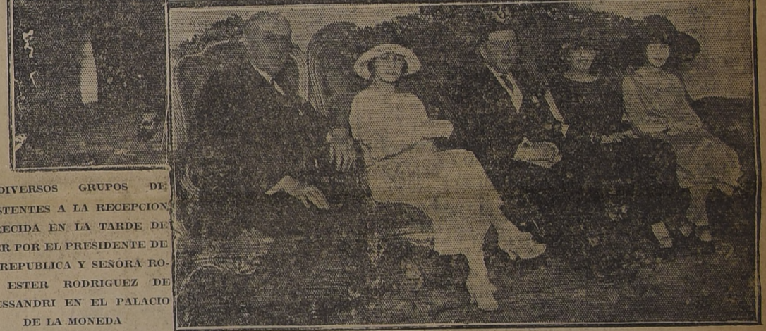
DIVERSOS GRUPOS DE ASISTENTES A LA RECEPCION OFRECIDA EN LA TARDE DE AYER POR EL PRESIDENTE DE LA REPUBLICA Y SEÑORA ROSA ESTER RODRIGUEZ DE ALESSANDRI EN EL PALACIO DE LA MONEDA