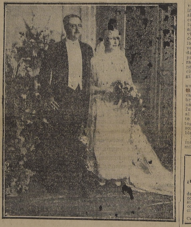
LOS NOVIOS SALIENDO DE LA IGLESIA DE SAN VICENTE DE PAUL.