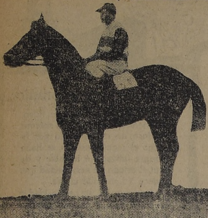
GITANILLO, gana dor de la 3.a carrera