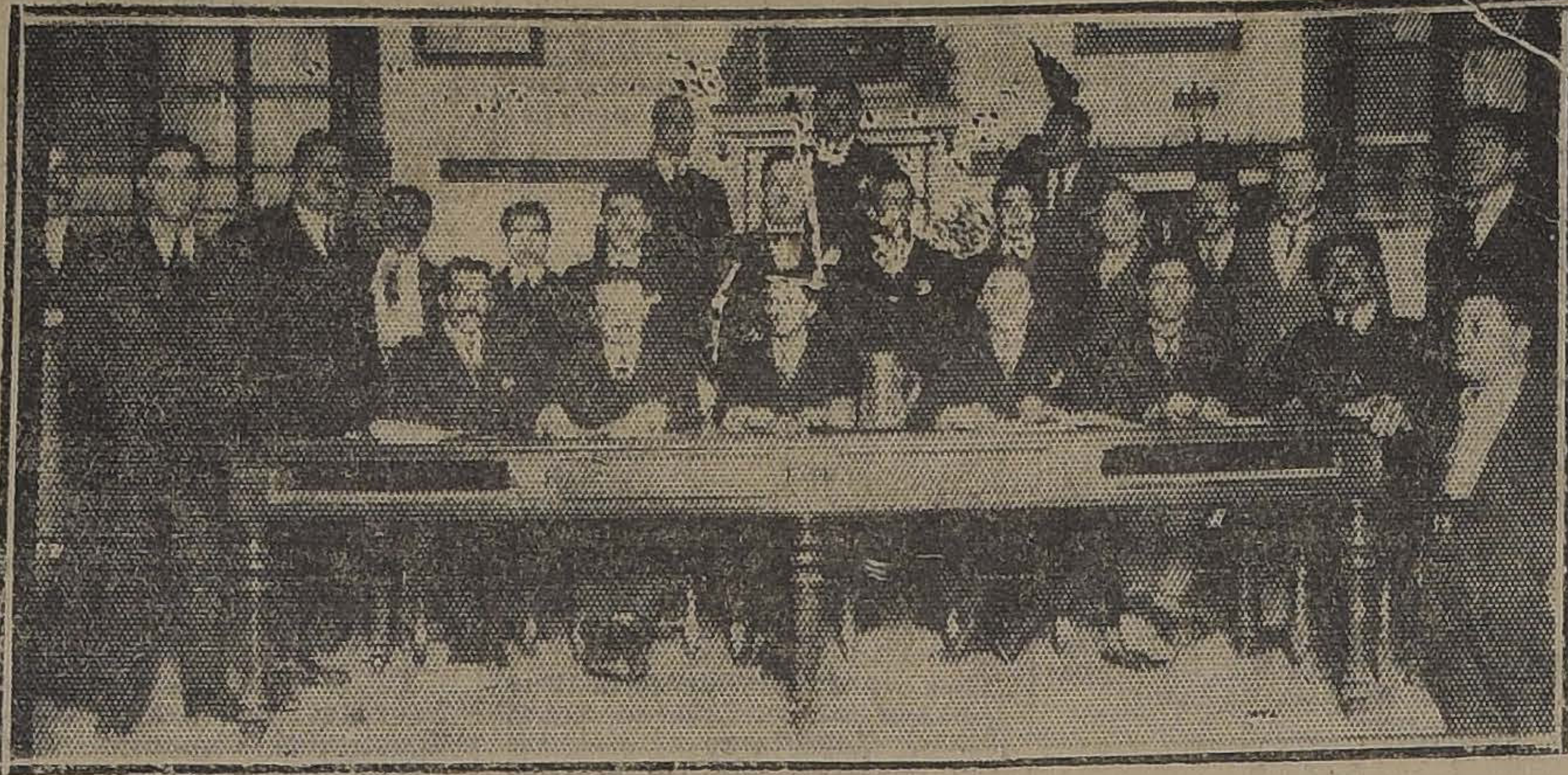
DURANTE LA ASAMBLA DE LA SOCIEDAD UNION DE PELUQUEROS

La sesión solemne de antenoche de transmisión del mando