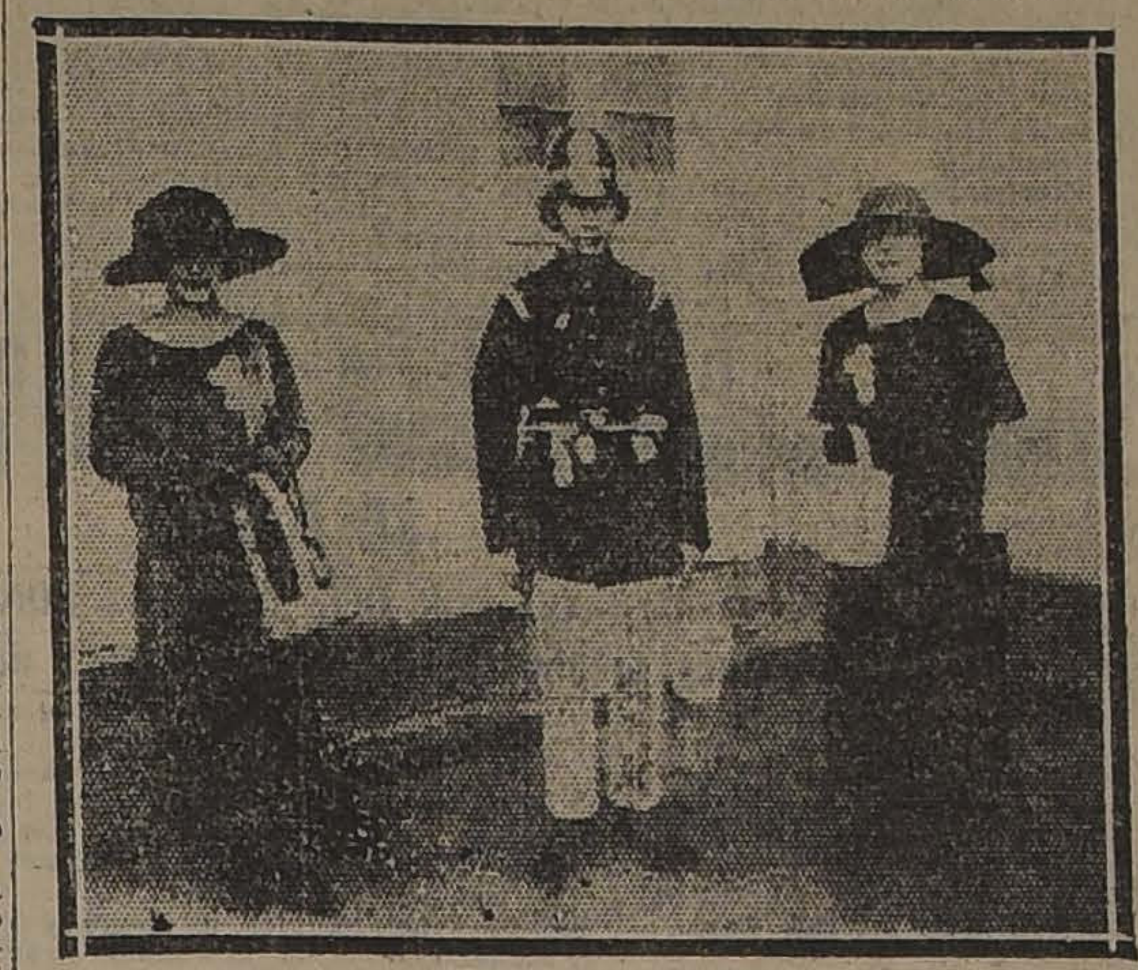
UNA COMISION COLECTADORA

mente al esfuerzo de los componentes de la institución y él es una evidente aunque innecesaria prueba del eficiente pie en que ella se encuentra. LA PARTICIPACION DE LA FUERZA AEREA La Superioridad de la Fuerza Aérea dispuso que durante la colecta algunos aviones evolucionaran sobre la ciudad arrojando volantes en que se invitaba al público a contribuir generosamente al resultado de la colecta. Este número del programa dió singular realce al simpático acto de ayer.