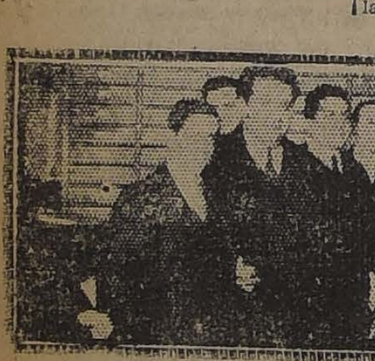
MOMENTOS ANTES DE ABRIR LA GRAN CAJA QUE CONTENIA LOS CUPONES ENVIADOS

Es conocido el entusiasmo con que el público ha acogido desde un principio el concurso abierto por "Los Tiempos", y el interés con que los innumerales lectores de este diario vespertino se dedican a utilizar los cupones obsequiados para tomar parte en él.