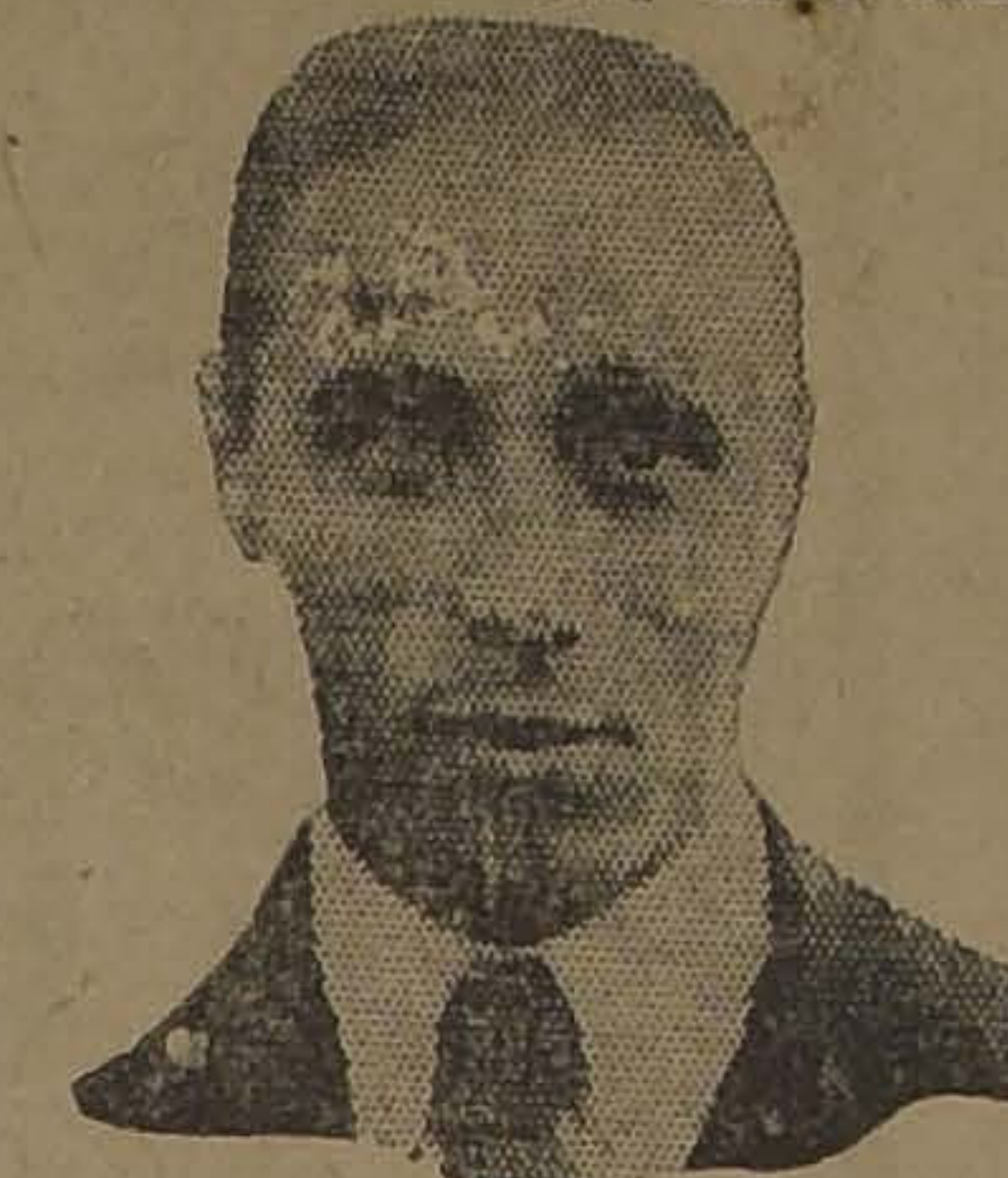
UNIVERSO ANGLADA Back del Audax