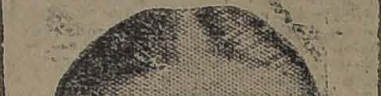
EL REY JORGE DE GRECIA

"Yo no abandono Grecia y cualquiera que desee obligarme a salir puede venir aquí y tratar de hacerlo".—(U. P.)