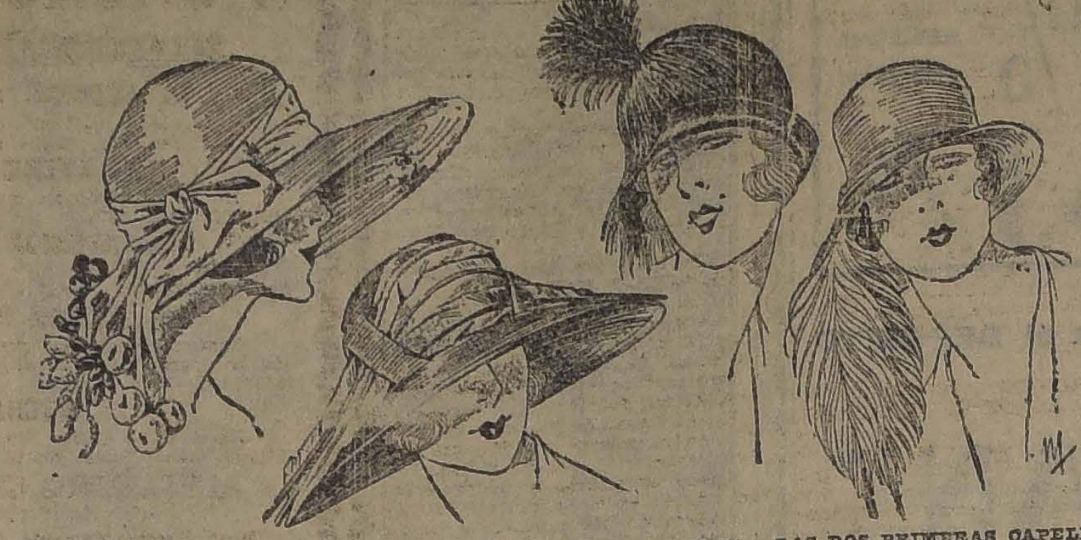
CUATRO LINDOS Y ELEGANTES SOMBREROS PARA LA ESTACION... LAS DOS PRIMERAS CAPELINAS DE GUSA; EL TERCERO ES UN SURTOSO Y BRANTADORO MEDIANO...