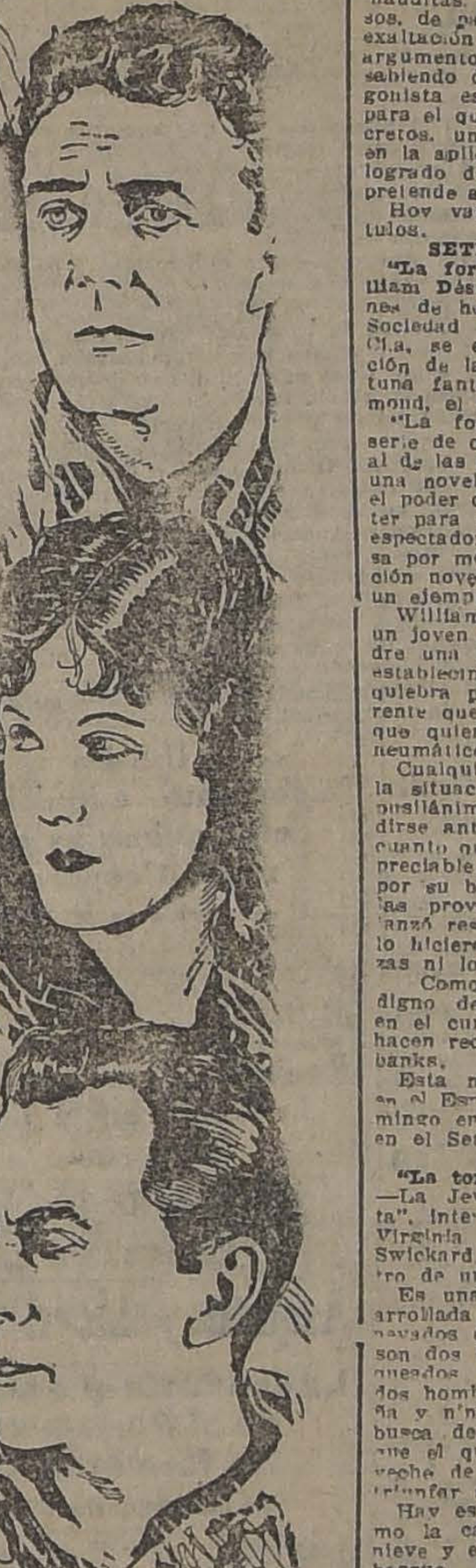
CREACION DE House Peters, Virginia Valli y Matt Moore