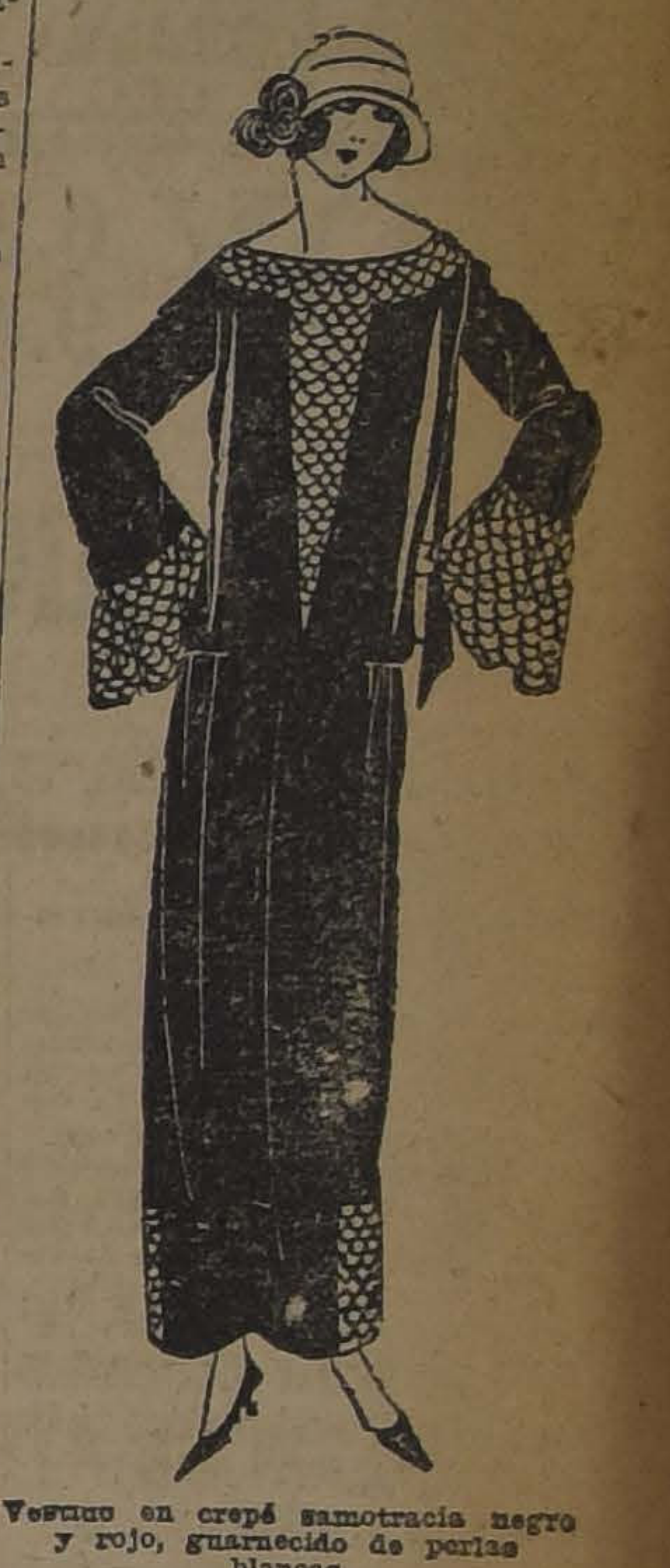
Vestido en crepé satenizada negro y rojo, guarnecido de perlas blancas

SEGURO, CONTRA INCENDIOS, HABITACIONES FRESCAS Y CONFORTABLES. BRISTOL HOTEL. ESPECIFICOS MEDICINALES. LABORATORIO LONDRES.