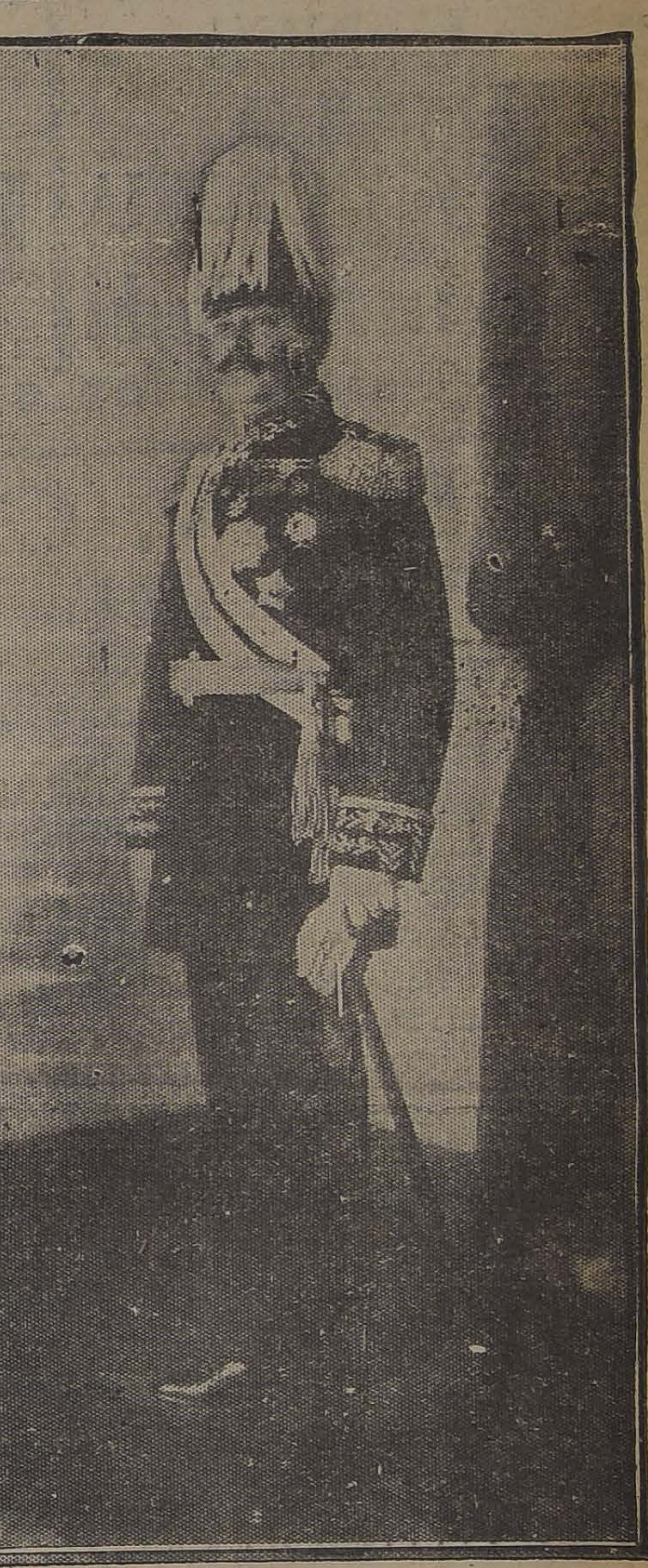
Vice-Presidente de la República, General D. Luis Altamirano

En un Consejo de Gabinete celebrado en las últimas horas de la tarde de ayer, se consideró ampliamente la situación del país en el extranjero acerca del movimiento militar.