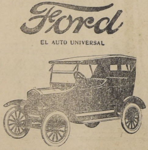
Ford EL AUTO UNIVERSAL